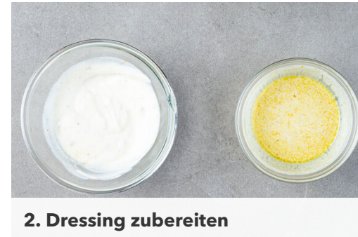
2. Dressing zubereiten

Die Zwiebel schälen, halbieren und fein würfeln. Den Knoblauch schälen und ebenfalls fein würfeln. Die Gurke längs halbieren und quer in dünne Scheiben schneiden.