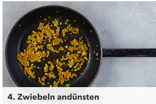
4. Zwiebeln andünsten

Die Tomate in Spalten schneiden und unter den Salat mengen.