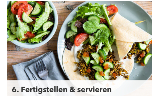
6. Fertigstellen & servieren

Das Hackfleisch sowie je 1 kräftige Prise Salz und Pfeffer hinzufügen und bei starker Hitze ca. 5Min. unter gelegentlichem Rühren braun braten. Das restliche Aprikosenchutney und die getrockneten Aprikosen hinzugeben, ca. 2Min. weiter braten und nach Geschmack mit Salz und Pfeffer würzen.