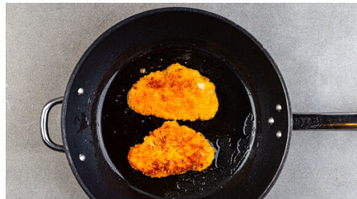
4. Schnitzel braten

Die Tomaten in 1-2cm breite Spalten schneiden. Die Lauchzwiebel in feine Ringe schneiden, den Koriander samt Stängeln grob schneiden.