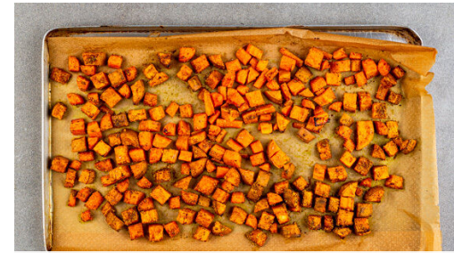
2. Gemüse backen

Den Backofen auf 240°C (220°C Umluft) vorheizen. Die Süßkartoffeln samt Schale in ca. 2cm große Würfel schneiden. Die Karotte ggf. schälen und ebenfalls in ca. 2cm große Würfel schneiden.