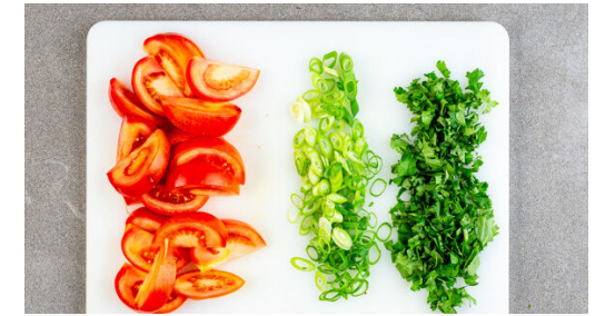
3. Garnitur schneiden

Die Süßkartoffeln und die Karotten auf einem mit Backpapier ausgelegten Backblech mit 1EL Pflanzenöl, dem Currypulver und ½TL Salz vermengen, dann im vorgeheizten Ofen 15-18Min. backen, bis das Gemüse gar ist.