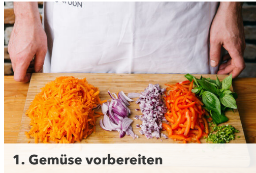
1. Gemüse vorbereiten

Energie 1141kcal, Fett 43.5g, Kohlenhydrate 125.3g, Eiweiß 54.4g