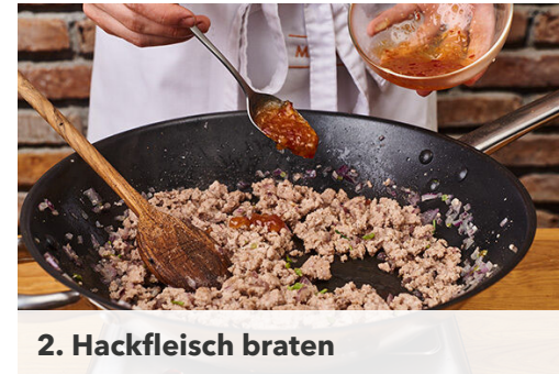
2. Hackfleisch braten

Das Hackfleisch gleichmäßig auf dem Teig verteilen und mit den Zwiebelstreifen belegen. Mit der ½ der Paprikastreifen und dem Käse bestreuen und die Pizza 15-20Min. im Ofen backen, bis der Teig goldbraun und gar ist.