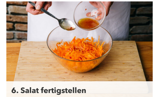
6. Salat fertigstellen

Den Teig mit dem Papier nach unten auf einem Backblech ausrollen und an den Rändern ca. 1cm breit nach innen umklappen.