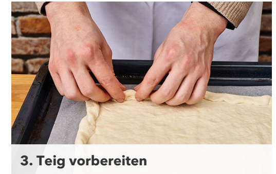
3. Teig vorbereiten

1EL Sweet-Chili-Sauce mit 1TL Pflanzenöl, 1TL Essig und je 1 Prise Salz und Pfeffer zu einem Dressing verrühren.