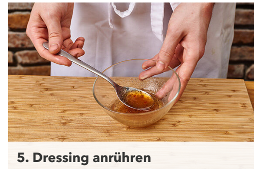
5. Dressing anrühren

Das Hackfleisch , die Zwiebelwürfel und die Basilikumstiele mit 1TL Pflanzenöl in einer mittelgroßen Pfanne bei mittlerer Hitze 3-5Min. krümelig anbraten. 1EL Sweet-Chili-Sauce unterrühren und mit je 1 Prise Salz und Pfeffer würzen.