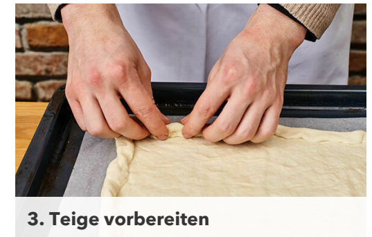
3. Teige vorbereiten

Die übrige Sweet-Chili-Sauce mit 1EL Pflanzenöl, 1EL Essig und je 1 Prise Salz und Pfeffer zu einem Dressing verrühren.