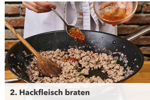
2. Hackfleisch braten

Das Hackfleisch gleichmäßig auf den Teigen verteilen und mit den Zwiebelstreifen belegen. Mit insgesamt der ½ der Paprikastreifen und dem Käse bestreuen und die Pizzen 15-20Min. im Ofen backen, bis der Teig goldbraun und gar ist. Je nach Ofen die Position der Bleche nach der Hälfte der Zeit tauschen.