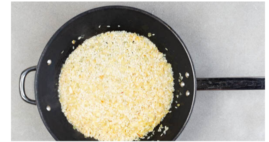
3. Risotto kochen

Das Fleisch trocken tupfen, mit Salz und Pfeffer würzen und in einer zweiten Pfanne mit 1EL Pflanzenöl bei starker Hitze auf jeder Seite 2-3Min. braten, abhängig davon, ob es medium oder eher durchgebraten sein soll. Aus der Pfanne nehmen und auf einem Teller abgedeckt ruhen lassen.