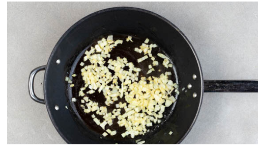
2. Risotto ansetzen

Den Brokkoli in mundgerechte Röschen zerteilen, den Strunk in 1-2cm große Stücke schneiden. Den Brokkoli mit 1EL Pflanzenöl, 1 kräftigen Prise Salz und 1 Prise Pfeffer auf einem mit Backpapier ausgelegten Backblech vermengen und im Ofen in 10-12Min. gar rösten.