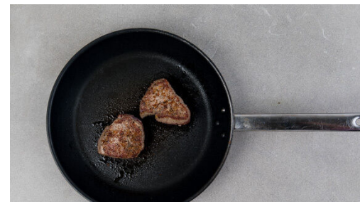
5. Fleisch braten

Die Zwiebel schälen, halbieren und fein würfeln. Den Knoblauch schälen und in feine Scheibchen schneiden. Die Zwiebeln und den Knoblauch in einer mittelgroßen Pfanne mit 1EL Butter bei mittlerer Hitze in 2-3Min. glasig anschwitzen.