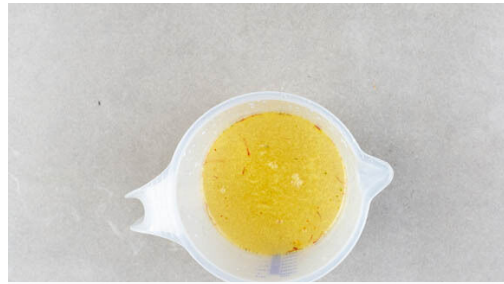
1. Safranbrühe zubereiten

Energie 874kcal, Fett 33.3g, Kohlenhydrate 92.7g, Eiweiß 47.3g