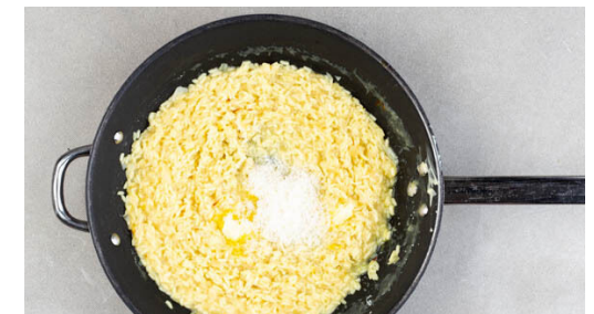
6. Risotto verfeinern

Den Reis hinzufügen und 1-2Min. leicht anrösten, dann nach und nach mit der Safranbrühe ablöschen und stetig rühren, damit der Reis nicht ansetzt. Diesen Vorgang 18-20Min. lang wiederholen, bis die Brühe aufgebraucht und der Reis bissfest ist. Evtl. etwas mehr Wasser zugeben.