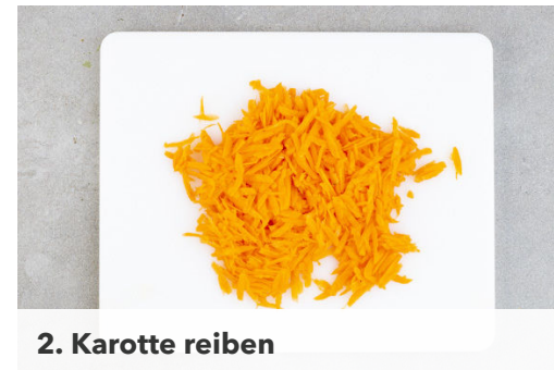
2. Karotte reiben

In einem mittelgroßen Topf ausreichend gesalzenes Wasser für die Nudeln zum Kochen bringen. Die Paprika vierteln, entkernen und in dünne Streifen schneiden. Die Lauchzwiebeln schräg in feine Ringe schneiden.