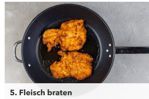
5. Fleisch braten

Den Salat in mundgerechte Stücke schneiden. Die Tomaten in dünne Scheiben schneiden. Aus 2EL Olivenöl, 1EL Essig und je 1 Prise Salz, Pfeffer und Zucker ein Dressing anrühren.