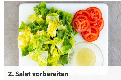
2. Salat vorbereiten

1EL Mayonnaise mit 1EL Ketchup und 2TL Olivenöl verrühren. Das Fleisch trocken tupfen, horizontal zu 2 Schnitzeln halbieren und mit einem Fleischklopfer oder einer schweren Pfanne leicht plattieren. Von beiden Seiten mit der Gewürzmischung sowie je 1 Prise Salz und Pfeffer einreiben, dann in der Sauce und anschließend im Panko-Paniermehl wenden.