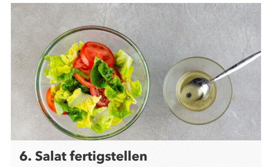
6. Salat fertigstellen

Die Kartoffeln in ein Sieb abgießen und mit 1EL Olivenöl sowie 1 Prise Salz vermengen. Auf ein mit Backpapier ausgelegtes Backblech geben und mit der Unterseite des Topfes leicht platt drücken, dann ca. 15min. im Ofen knusprig backen.