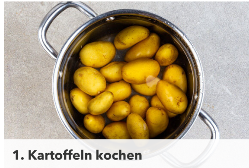
1. Kartoffeln kochen

Energie 1038kcal, Fett 57.9g, Kohlenhydrate 87.5g, Eiweiß 40.9g