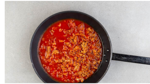
2. Fleischsauce kochen

In einem kleinen Topf 2EL Butter bei mittlerer Hitze schmelzen lassen. 2EL Mehl darüberstäuben und unter Rühren 1-2Min. andünsten. Vorsichtig 200ml Milch, 180ml Wasser und das übrige Brühgewürz einrühren und die Hitze leicht erhöhen. Die Béchamel unter regelmäßigem Rühren 4-5Min. leicht blubbernd köcheln lassen, bis sie recht flüssig vom Löffel rinnt, dann mit Salz und Pfeffer abschmecken.