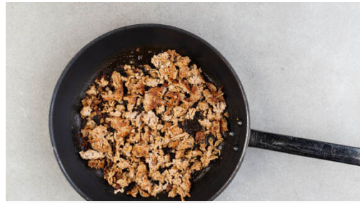
1. Hackfleisch braten

Energie 1135kcal, Fett 56.3g, Kohlenhydrate 109.7g, Eiweiß 47.5g