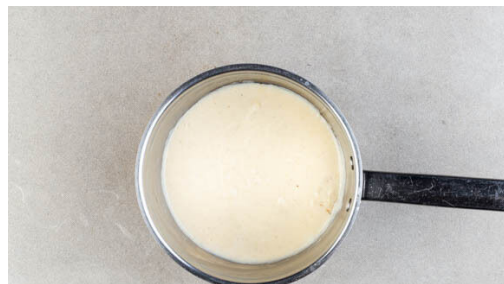
4. Béchamel kochen

Den Backofen auf 200°C (180°C Umluft) vorheizen. In einem mittelgroßen Topf ausreichend gesalzenes Wasser für die Pasta zum Kochen bringen. Das Hackfleisch mit der Gewürzmischung und \frac{1}{3} des Brühgewürzes in einer mittelgroßen Pfanne mit 1EL Olivenöl bei starker Hitze 3-4Min. krümelig anbraten.