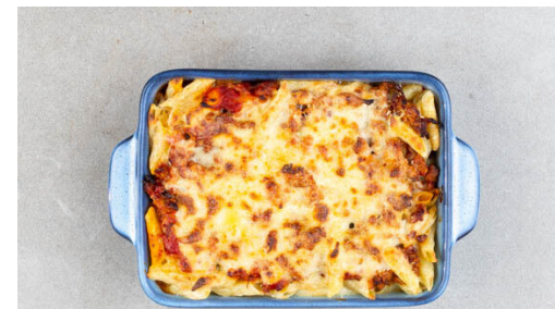
5. Pastitsio backen

Die passierten Tomaten zugeben. Die Hitze reduzieren und die Sauce abgedeckt bei mittlerer Hitze 4-5Min. köcheln lassen.