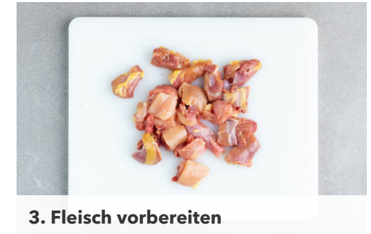
3. Fleisch vorbereiten

Das Fleisch in der Pfanne mit 1EL Olivenöl bei starker Hitze 2-3Min. anbraten. Die Pilze zugeben und 2Min. mitbraten. Den weißen Lauch und den Knoblauch zufügen und weitere 1-2Min. braten. 1EL Mehl und die ½ des Brühgewürzes einrühren, dann 200ml heißes Wasser und die Crème fraîche unterrühren. Die Sauce noch 2-3Min. köcheln lassen. Mit Salz und Pfeffer abschmecken.