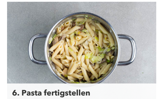
6. Pasta fertigstellen

Das Fleisch trocken tupfen, in 3-4cm große Stücke schneiden und mit je 1 Prise Salz und Pfeffer würzen.