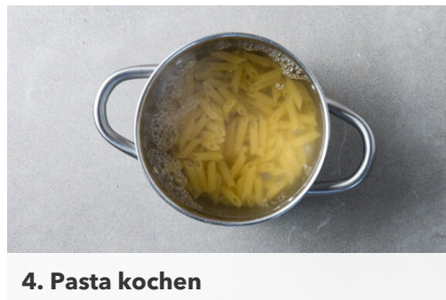
4. Pasta kochen

In einem mittelgroßen Topf ausreichend gesalzenes Wasser für die Pasta zum kochen bringen. Den Lauch längs halbieren und quer in dünne Streifen schneiden. Etwas Lauchgrün für die Garnitur beiseitelegen. Die Pilze ggf. säubern und vierteln. Den Knoblauch schälen und in feine Scheibchen schneiden.