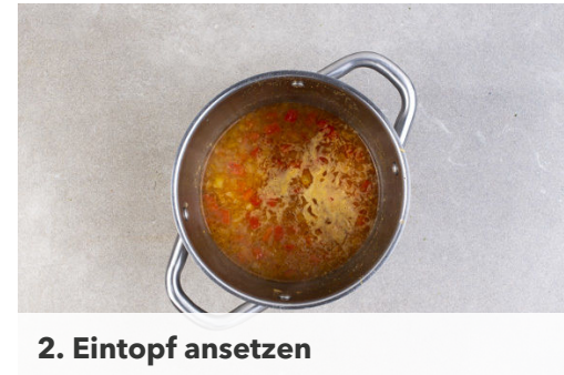
2. Eintopf ansetzen

Das Fleisch in einer großen Pfanne mit 2EL Olivenöl bei mittlerer bis starker Hitze 2-3Min. scharf anbraten. Die Hitze reduzieren, das Fleisch mit dem Limettensaft ablöschen und die Limettenschale unterrühren.