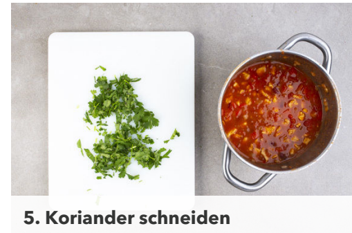
5. Koriander schneiden

Die Paprika und die Zwiebeln in einem großen Topf mit 2EL Olivenöl bei mittlerer Hitze 1-2Min. farblos anschwitzen. Den Knoblauch hinzugeben und ca. 1Min. mitbraten. Mit 400ml Wasser ablöschen, das Brühwürz unterrühren und alles einmal aufkochen lassen.