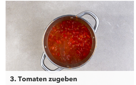
3. Tomaten zugeben

Den Koriander samt Stängeln fein schneiden. Den Eintopf mit Salz und Pfeffer sowie Peperoni nach Geschmack würzen und das Fleisch unterrühren.