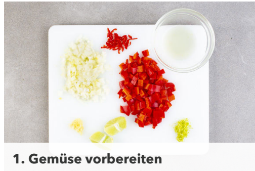
1. Gemüse vorbereiten

Energie 686kcal, Fett 20.0g, Kohlenhydrate 55.4g, Eiweiß 37.4g