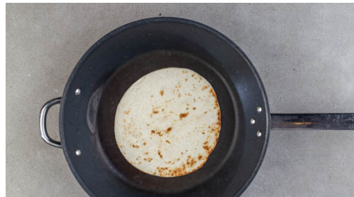
4. Tortillas erwärmen

Die Karotte ggf. schälen und grob raspeln. Den Apfel halbieren, entkernen und ebenfalls grob raspeln. Die Lauchzwiebel fein hacken. Den Weißkohl mit den Karotten , dem Apfel und der Lauchzwiebel vermengen. Den Joghurt , 1½EL Essig, die Gewürzmischung und 1 kräftige Prise Salz zugeben und alles mit den Händen gründlich verkneten.