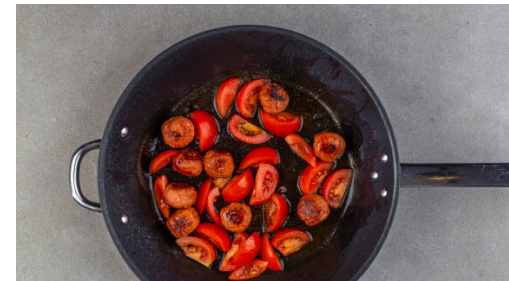
5. Tomaten zugeben

Die Tomaten in ca. 0,5cm breite Spalten schneiden.