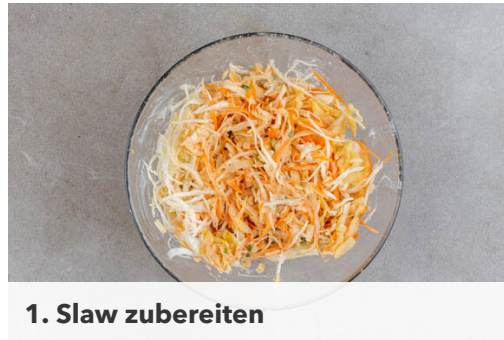
1. Slaw zubereiten

Energie 619kcal, Fett 18.8g, Kohlenhydrate 72.0g, Eiweiß 37.5g