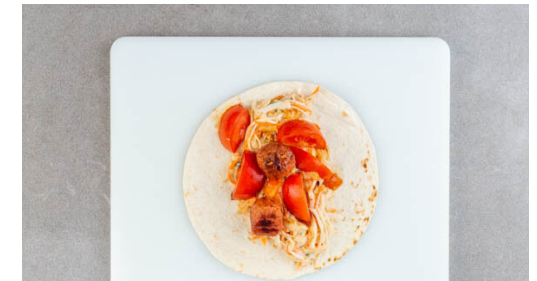
6. Wraps fertigstellen

Das Fleisch trocken tupfen und in einer mittelgroßen Pfanne mit ½EL Olivenöl bei mittlerer Hitze in 4-5Min. rundum goldbraun braten.