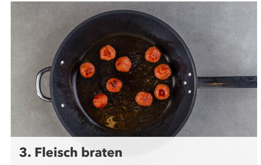
3. Fleisch braten

Die Tomaten zu dem Fleisch in die Pfanne geben und ca. 1Min. mitbraten. Mit Salz und Pfeffer würzen.