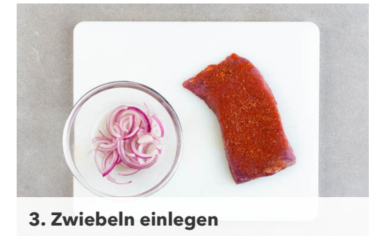
3. Zwiebeln einlegen

Die ½ der Karotten , die ½ der Zwiebeln und die Chilischote in einer mittleren Auflaufform mit der ½ der Gewürzmischung , 1 kräftigen Prise Salz und 2EL Olivenöl vermengen. Die Zucchini und die übrigen Karotten auf einem mit Backpapier ausgelegten Blech mit 2EL Olivenöl, dem Oregano und ½TL Salz vermengen. Alles im Ofen ca. 15Min. rösten; das Blech oben einhängen.