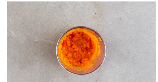
6. Salsa pürieren

Die Pfanne auswischen und 3-4 Tortillas darin bei mittlerer bis starker Hitze ohne Öl auf jeder Seite 15-20Sek. erwärmen. Abgedeckt beiseitestellen und den Vorgang mit den übrigen Tortillas wiederholen.