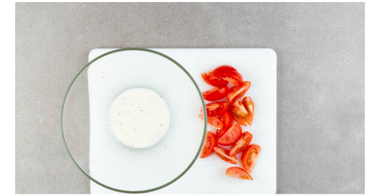
3. Tomaten schneiden

Die Zwiebel schälen, halbieren, in dünne Streifen schneiden und in einer mittelgroßen Pfanne mit 2EL Pflanzenöl und 1 Prise Salz bei starker Hitze ca. 3Min. anbraten. 2-3EL Wasser zugeben und die Hitze reduzieren. Die Zwiebeln bei mittlerer Hitze 5-6Min. weiterbraten, bis sie weich und appetitlich gebräunt sind.