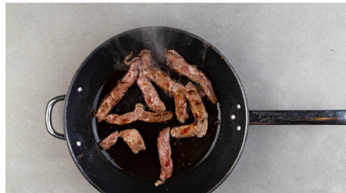
4. Fleisch braten

Die Tomaten in Spalten schneiden. 1TL Mayonnaise und 1TL hellen Essig mit je 1 Prise Salz und Pfeffer zu einem Dressing verrühren.