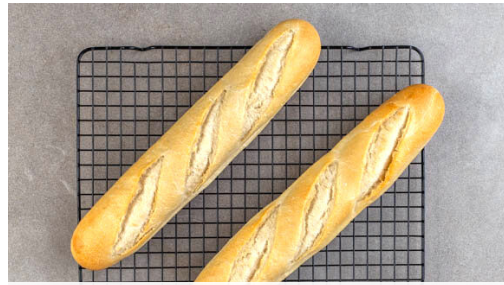
1. Brötchen aufbacken

Energie 902kcal, Fett 43.2g, Kohlenhydrate 78.8g, Eiweiß 49.9g