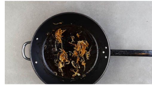
2. Zwiebeln braten

Den Backofen auf 180°C (160°C Umluft) vorheizen. Die Brötchen in den noch aufheizenden Ofen geben und in 8-10Min. leicht knusprig erwärmen.