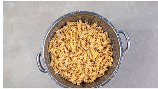
1. Pasta kochen

Energie 1150kcal, Fett 46.3g, Kohlenhydrate 113.9g, Eiweiß 66.7g