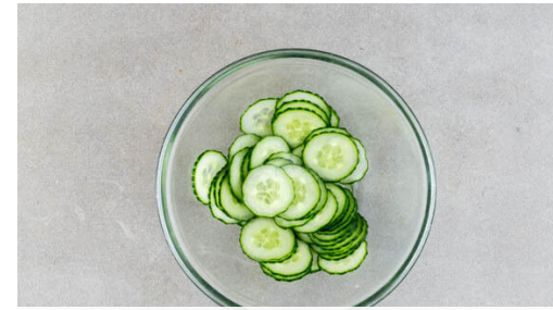
2. Gurke einlegen

In einem großen Topf ausreichend gesalzenes Wasser für die Pasta zum Kochen bringen. Die Pasta in das kochende Wasser geben und in 11-13Min. bissfest kochen. In ein Sieb abgießen und abtropfen lassen.