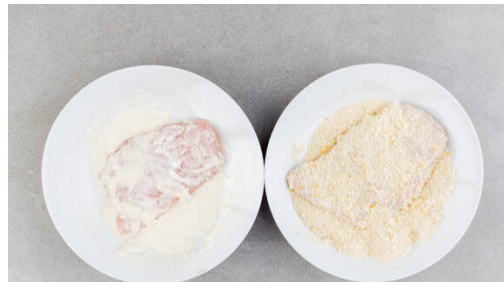
4. Schnitzel panieren

Die Zitrone vierteln. Den Dill fein schneiden. Die Rote-Bete-Flüssigkeit vorsichtig abgießen und auffangen, ggf. die Rote Bete in ein Sieb abgießen. Die Rote Bete in ca. 1cm große Würfel schneiden. Tipp: Da Rote Bete stark färbt, beim Verarbeiten am besten Küchenhandschuhe und Schürze tragen.