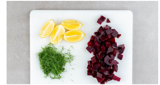
3. Zutaten vorbereiten

Die Gurke in dünne Scheiben schneiden. Je 2 kräftige Prisen Salz und Zucker in 2EL hellem Essig auflösen und mit den Gurkenscheiben vermengen.