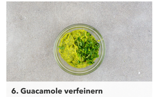
6. Guacamole verfeinern

Die Pattys in einer großen Pfanne mit 1EL Olivenöl bei mittlerer Hitze auf jeder Seite 2-3Min. anbraten. Die Burgerbrötchen aufschneiden und 2-3Min. im Ofen aufbacken.