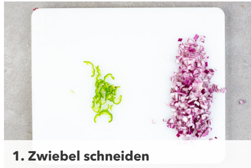
1. Zwiebel schneiden

Energie 982kcal, Fett 53.2g, Kohlenhydrate 91.3g, Eiweiß 37.0g