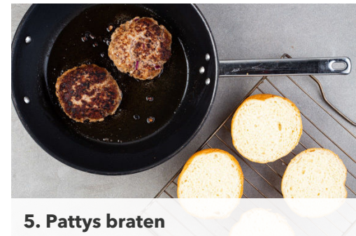
5. Pattys braten

Das Hackfleisch mit den restlichen Zwiebeln sowie Salz und Pfeffer gut verkneten, zu 2 gleich großen Kugeln formen und diese zu ca. 1cm dicken Pattys flach drücken.