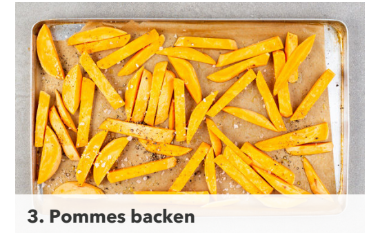
3. Pommes backen

Die Tomaten vierteln. Das Kerngehäuse rauschneiden, in ein hohes Gefäß geben und mit der ½ der Sweet-Chili-Sauce oder mehr und 1EL Olivenöl pürieren. Den Koriander samt Stängeln fein schneiden. Das Tomatenfruchtfleisch in kleine Würfel schneiden und mit der ½ der Zwiebeln und ca. ⅔ des Korianders unter das Püree mengen. Mit Salz und Peperoni nach Geschmack würzen.