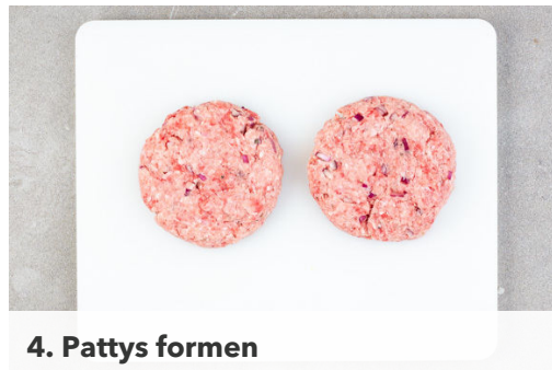
4. Pattys formen

Die Süßkartoffeln ggf. schälen und in ca. 1cm breite, pommesartige Stifte schneiden. Auf einem mit Backpapier ausgelegten Backblech mit 1EL Olivenöl sowie Salz und Pfeffer vermengen, gleichmäßig verteilen und ca. 15Min. im Ofen goldbraun backen.