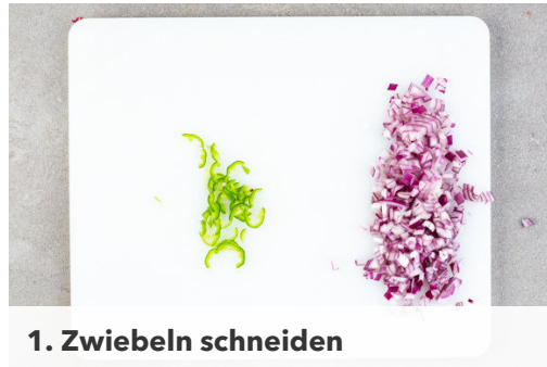
1. Zwiebeln schneiden

Energie 943kcal, Fett 53.1g, Kohlenhydrate 81.8g, Eiweiß 36.6g