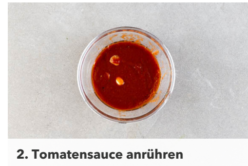
2. Tomatensauce anrühren

Den Teig mit dem Papier nach unten ausrollen und die Tomatensauce darauf verstreichen. Die Pizza gleichmäßig mit dem Schinken und den Birnen belegen, mit dem Käse bestreuen und vorsichtig mit dem Papier auf das vorgeheizte Backblech ziehen. Im Ofen in 15-20Min. goldbraun und knusprig backen.