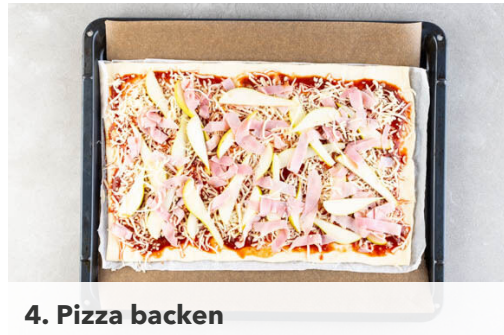
4. Pizza backen

Den Backofen mit dem Backblech auf 250°C (230°C Umluft) vorheizen. Die Lauchzwiebel in feine Ringe schneiden. Den Knoblauch schälen und in feine Scheibchen schneiden. Den Rucola ggf. verlesen.