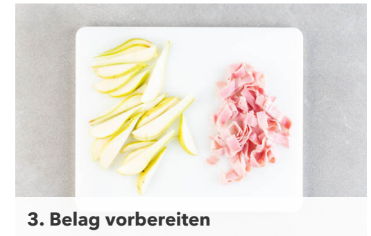
3. Belag vorbereiten

Die Tomaten in dünne Spalten schneiden, dabei den Strunk entfernen. 1EL Olivenöl mit 1EL Essig verrühren und das Dressing nach Belieben mit Salz und Pfeffer sowie etwas Honig oder 1 Prise Zucker abschmecken. Die Tomaten und die Lauchzwiebeln mit dem Dressing vermengen.