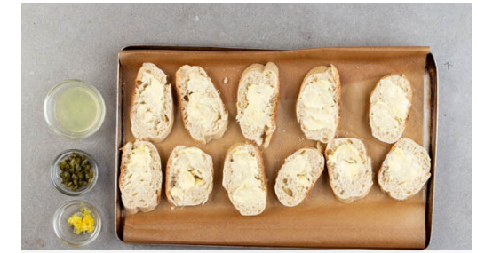
3. Brot rösten

Den Knoblauch schälen und fein würfeln. Den Lauch längs halbieren und in ca. 5cm große Stücke schneiden, die Karotten ggf. schälen, längs halbieren und in dünne, pommesartige Stifte schneiden. Auf einem mit Backpapier ausgelegten Backblech mit 2EL Olivenöl, der ½ des Knoblauchs sowie je 1 kräftigen Prise Salz und Pfeffer vermengen. Im Ofen in 15-17Min. goldbraun und weich backen.