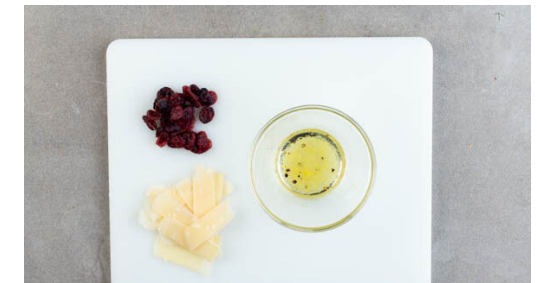
6. Salat zubereiten

Die Kapern , 4EL Zitronensaft und 2EL Butter in derselben Pfanne bei mittlerer Hitze ca. 1Min. erwärmen, dann 1,5EL Mehl unter Rühren hinzufügen, unter Rühren aufkochen und die Sauce 2-3Min. einköcheln lassen. Mit ggf. mehr Brühgewürz und Pfeffer abschmecken.