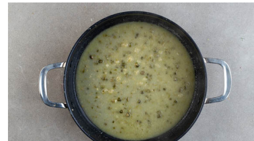
5. Sauce köcheln

Die Stubenküken samt Flüssigkeit ggf. portionsweise in einer großen Pfanne mit 2EL Olivenöl bei mittlerer bis starker Hitze ca. 2Min. braten, bis die Haut knusprig wird, dann ohne Bratensaft auf das Backblech zu dem Gemüse geben und in 7-8Min. vollständig erwärmen. Die Pfanne samt Bratensaft aufbewahren.