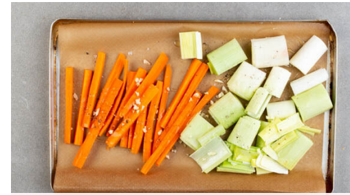
2. Gemüse backen

Den Ofen auf 240°C (220°C Umluft) vorheizen. 3EL Butter Raumtemperatur annehmen lassen. Die Cranberrys mit warmem Wasser bedecken und einweichen lassen.