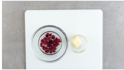
1. Zutaten vorbereiten

Den Ofen auf 240°C (220°C Umluft) vorheizen. 3EL Butter Raumtemperatur annehmen lassen. Die Cranberrys mit warmem Wasser bedecken und einweichen lassen.