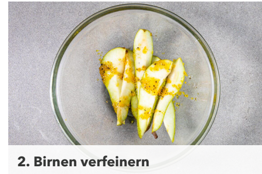
2. Birnen verfeinern

Den Backofen auf 200°C (180°C Umluft) vorheizen. Die Burrata aus dem Kühlschrank nehmen. Die Birne achteln und entkernen. Die 1/2 der Orangenschale abreiben.