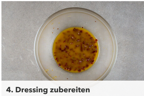
4. Dressing zubereiten

Den Schinken ggf. kleiner schneiden, dann jedes Stück Birne mit einer Scheibe Schinken umwickeln und auf einem mit Backpapier ausgelegten Backblech verteilen. Ggf. übriges Würzöl darüberträufeln. Die Birnen in Serrano 10-12Min. im Ofen backen, bis die Birnen weich sind und der Schinken knusprig ist.