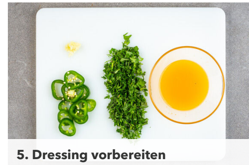
5. Dressing vorbereiten

Das Gemüse auf einem mit Backpapier ausgelegten Backblech mit 1EL Olivenöl und je 1 Prise Salz und Pfeffer vermengen. Im Ofen ca. 5Min. backen.