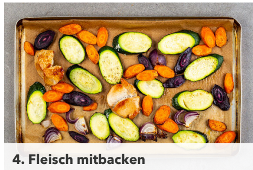
4. Fleisch mitbacken

Den Backofen auf 240°C (220°C Umluft) vorheizen. In einem kleinen Topf 350ml leicht gesalzenes Wasser für die Quinoa zum Kochen bringen. Die Karotten ggf. schälen, und schräg in ca. 1cm dicke Scheiben schneiden. Die Zucchini ebenfalls schräg in ca. 1cm dicke Scheiben schneiden. Die Zwiebel schälen, halbieren und jede Hälfte in vier Spalten schneiden.