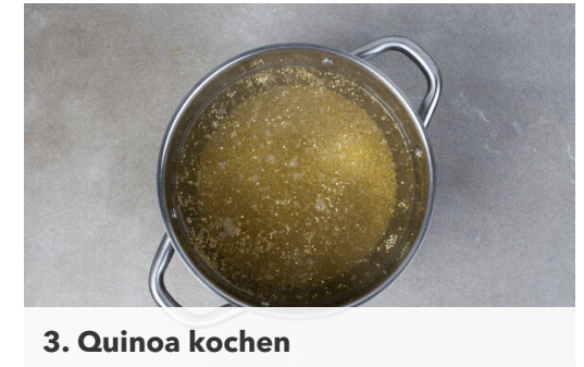
3. Quinoa kochen

Die Orange halbieren und auspressen. Den Knoblauch schälen und sehr fein würfeln oder durch eine Knoblauchpresse drücken. Die Chilischote in feine Ringe schneiden. Tipp: Für weniger Schärfe die Kerne entfernen. Den Koriander samt Stängeln grob schneiden.