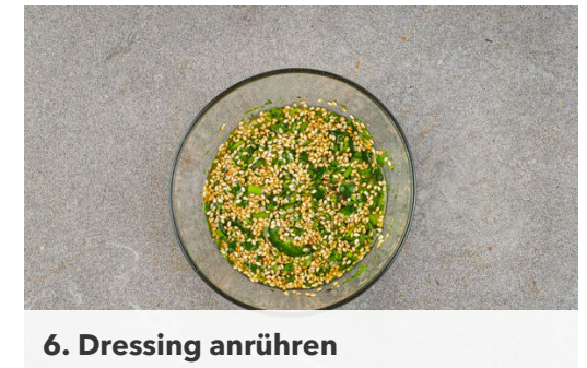
6. Dressing anrühren

Die Quinoa in einem feinmaschigen Sieb mit warmem Wasser abspülen, in das kochende Wasser geben und 10-12Min. abgedeckt bei niedriger bis mittlerer Hitze sanft köcheln lassen. Vom Herd nehmen und bis zum Servieren warm halten.