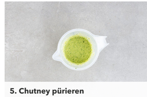
5. Chutney pürieren

Den Koriander samt Stängeln grob schneiden. Den Ingwer schälen und grob würfeln.