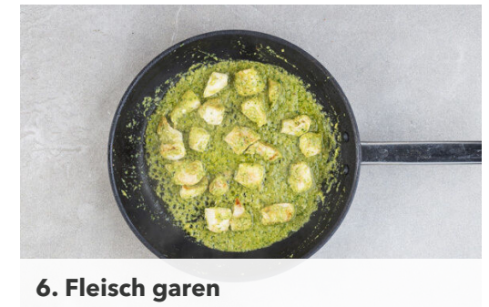
6. Fleisch garen

Ca. ⅔ des Korianders mit dem Ingwer , den Erdnüssen , 100ml kaltem Wasser, 2EL Pflanzenöl, 1EL Essig, 1TL Zucker und 1 kräftigen Prise Salz in einem hohen Gefäß möglichst glatt pürieren.