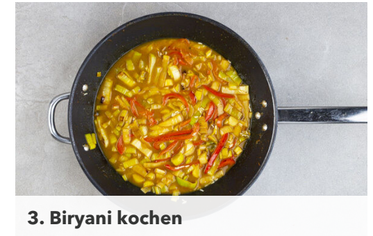
3. Biryani kochen

Die Paprika und den Lauch in einer mittelgroßen Pfanne mit 1EL Pflanzenöl und 1 Prise Salz bei mittlerer Hitze 2-3Min. anbraten. Dann die ½ der Currypaste unterrühren und ca. 2Min. mitbraten.