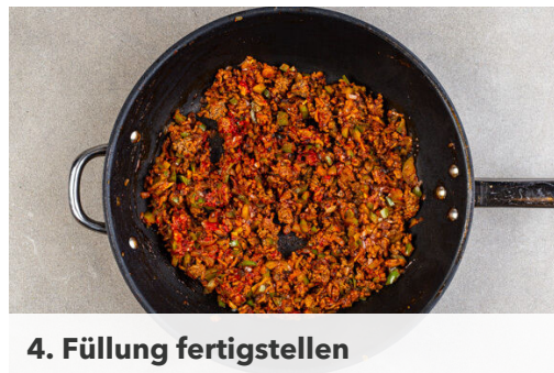
4. Füllung fertigstellen

Das Hackfleisch in einer mittelgroßen Pfanne mit 1EL Olivenöl bei mittlerer Hitze in 3-4Min. krümelig anbraten.