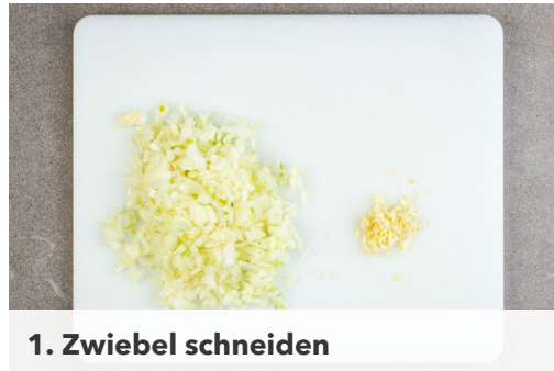
1. Zwiebel schneiden

Energie 1101kcal, Fett 74.2g, Kohlenhydrate 65.0g, Eiweiß 36.9g