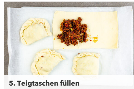
5. Teigtaschen füllen

Die Zwiebeln , den Knoblauch und die Paprika zum Fleisch in die Pfanne geben und 2-3Min. mitbraten. Das Paprikapulver nach Geschmack und das Tomatenmark unterrühren, mit 50ml Wasser ablöschen und alles 2-3Min. sanft einköcheln lassen. Anschließend ca. \frac{1}{3} der Petersilie unterrühren. Mit Salz und Pfeffer abschmecken.