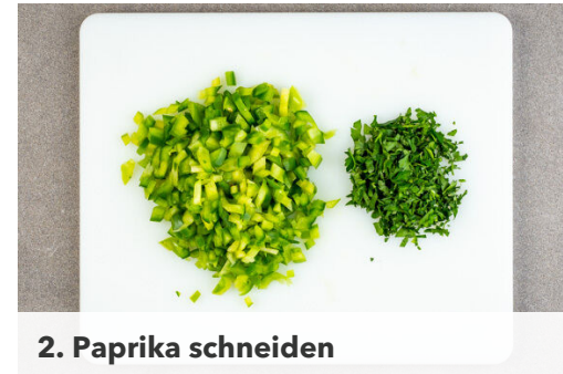
2. Paprika schneiden

Den Backofen auf 220°C (200°C Umluft) vorheizen. Den Teig bis zur Verwendung im Kühlschrank aufbewahren. Die Zwiebel schälen, halbieren und in möglichst kleine Würfel schneiden. Den Knoblauch schälen und ebenfalls fein würfeln.