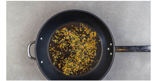
3. Topping vorbereiten

Die gerösteten Tomaten und die Lauchzwiebeln grob schneiden und in einem hohen Gefäß bis zur gewünschten Textur pürieren. Tipp: Wer nicht pürieren will, kann die Zutaten auch einfach klein schneiden. 2EL Olivenöl und 1EL Essig unterrühren und die Salsa mit Salz und Pfeffer abschmecken.