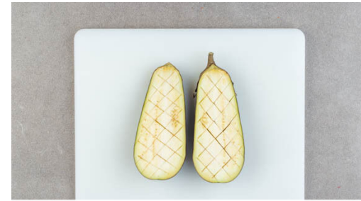
2. Zutaten vorbereiten

Die Auberginen auf dem Grill oder in einer Grillpfanne bei mittlerer Hitze in 15-20Min. weich grillen, dabei regelmäßig wenden. Vom Grill nehmen und abgedeckt warm halten. Die Tomaten und die Lauchzwiebeln rundum 5-7Min. grillen, bis Röstspuren sichtbar sind. Das Fleisch mit 2EL Olivenöl einreiben und auf jeder Seite 2-3Min. grillen, dann abgedeckt 5-10Min. ruhen lassen.