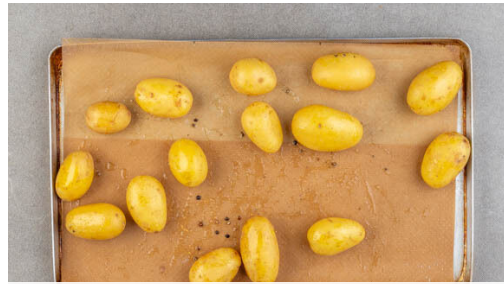
1. Kartoffeln rösten

Energie 691kcal, Fett 36.0g, Kohlenhydrate 52.9g, Eiweiß 38.4g