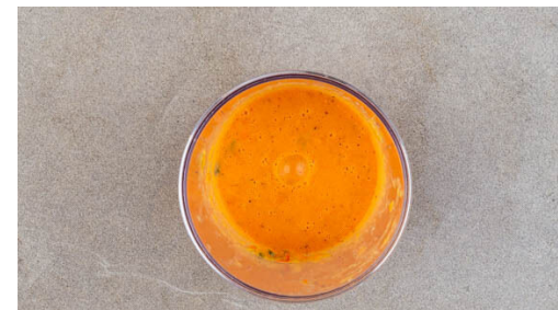
5. Salsa zubereiten

Die Auberginen längs halbieren, auf den Schnittseiten kreuzweise einschneiden und mit Salz würzen. Die Auberginen beiseitestellen; ausgetretene Flüssigkeit direkt vor dem Grillen mit Küchenkrepp abwischen. Das Fleisch trocken tupfen, großzügig mit Salz und Pfeffer würzen und abgedeckt beiseitestellen.