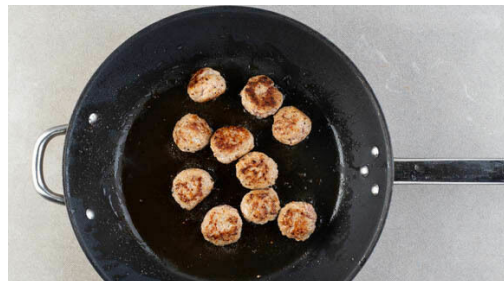
4. Hackbällchen zubereiten

In einem mittelgroßen Topf 800ml leicht gesalzenes Wasser für den Reis zum Kochen bringen. Die Zwiebeln schälen und halbieren, eine Zwiebel fein würfeln, die andere Zwiebel in feine Streifen schneiden. Den Knoblauch schälen und in feine Scheibchen schneiden.