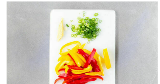
3. Gemüse schneiden

In der Zwischenzeit die Paprika und die Zwiebelstreifen in einer zweiten großen Pfanne mit 2EL Olivenöl bei starker Hitze 2-3Min. scharf anbraten. Die Hitze reduzieren, den Knoblauch , den restlichen Ingwer , die Ananas samt Saft und die Saucen unterrühren und ca. 1Min. köcheln lassen. Mit Salz, Pfeffer und 2EL Essig abschmecken, dann die Hackbällchen untermengen.