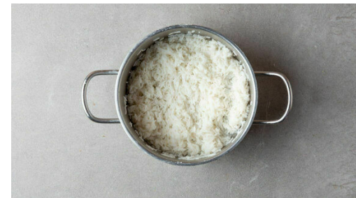
2. Reis kochen

Das Hackfleisch , die Zwiebelwürfel und ca. \frac{2}{3} des Ingwers mit je 1 kräftigen Prise Salz und Pfeffer gut verkneten. Ca. 20 Hackbällchen formen und diese in einer großen Pfanne mit 2EL Olivenöl bei mittlerer Hitze 4-5Min. rundum anbraten.