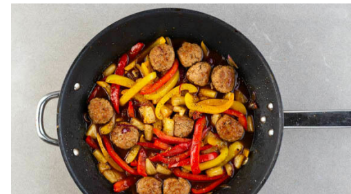
5. Paprika braten

Den Reis in einem Sieb kalt abspülen, bis das Wasser klar bleibt. Sobald das Wasser kocht, den Reis hineingeben und abgedeckt bei niedrigster Hitze 10-12Min. kochen, bis das Wasser aufgesogen und der Reis gar ist. Noch ca. 5Min. ohne Hitzezufuhr ziehen lassen.