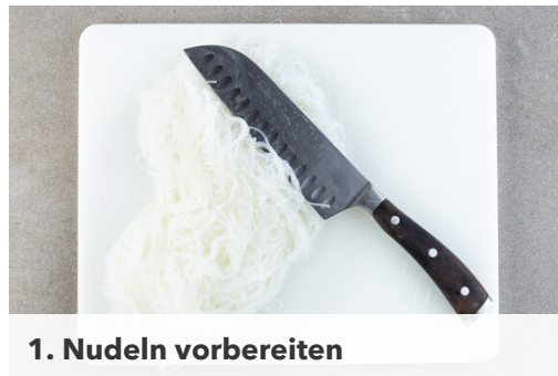
1. Nudeln vorbereiten

Energie 698kcal, Fett 36.3g, Kohlenhydrate 67.2g, Eiweiß 26.9g