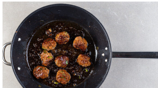
4. Hackbällchen braten

In einem mittelgroßen Topf ausreichend gesalzenes Wasser für die Nudeln zum Kochen bringen. Den Topf vom Herd nehmen, die Nudeln in das heiße Wasser geben und abgedeckt in 3-5Min. gar ziehen lassen. Die Nudeln in ein Sieb abgießen und abtropfen lassen. Tipp: Um die Weiterverarbeitung zu erleichtern, die Nudeln ggf. 1-2 Mal durchschneiden.