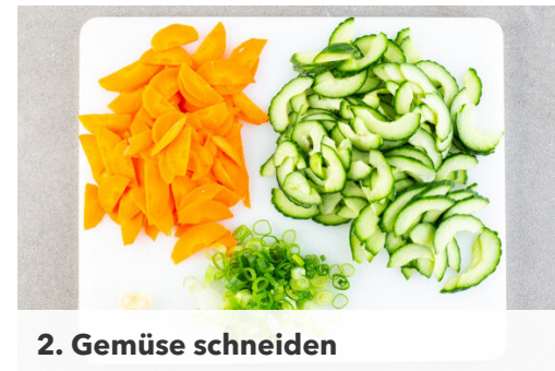
2. Gemüse schneiden

Das Hackfleisch mit dem Knoblauch , den Lauchzwiebeln , 1TL Honig sowie je 1 kräftigen Prise Salz und Pfeffer gut verkneten. 8-10 gleich große Kugeln formen, diese leicht platt drücken und in einer großen Pfanne mit 2EL Pflanzenöl bei mittlerer Hitze auf jeder Seite 2-3Min. anbraten. Die ½ des Ketjap Manis unterrühren und die Pfanne beiseitstellen.