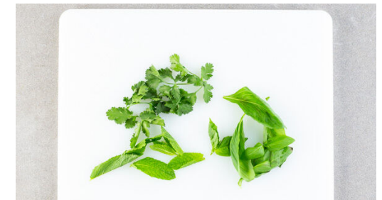
6. Garnitur vorbereiten

Die Limettenschale abreiben, dann die Limette halbieren und auspressen.