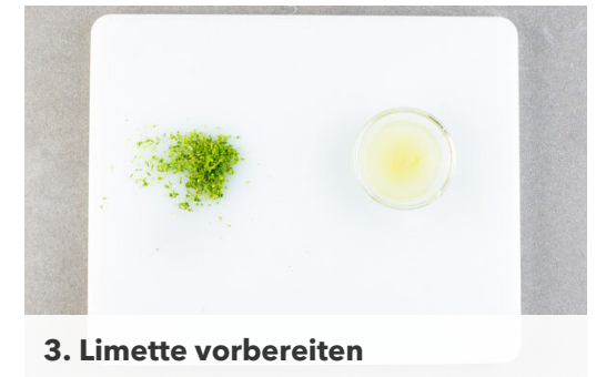
3. Limette vorbereiten

Die ½ der Fischsauce mit der Limettenschale und dem Limettensaft verrühren und das Dressing mit Salz und Zucker abschmecken. Tipp: Wer mag, kann auch mehr Fischsauce verwenden. Die Karotten und die Gurken mit dem Dressing vermengen.