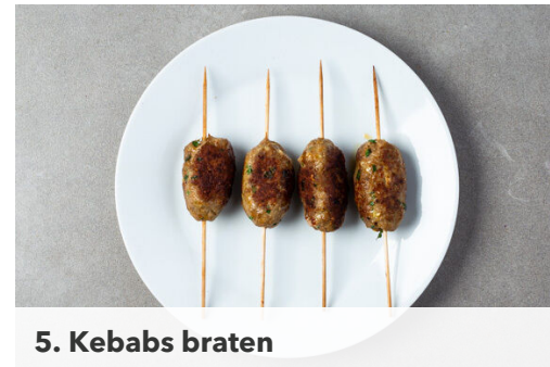
5. Kebabs braten

Die Tomate vierteln und in einem hohen Gefäß mit 1EL Olivenöl fein pürieren.