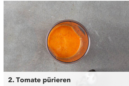
2. Tomate pürieren

Die Paprika und die Zwiebeln in einer großen Pfanne mit 1EL Olivenöl bei starker Hitze 2-3Min. scharf anbraten. Den restlichen Knoblauch , die pürierte Tomate und die Zwiebelmarmelade unterrühren und ca. 1Min. mitkochen. Die Pfanne vom Herd nehmen und das Gemüse mit Salz, Pfeffer und Zucker abschmecken. Den Dill unterheben.