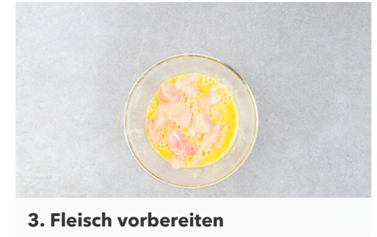
3. Fleisch vorbereiten

Eine große Pfanne 1-2cm hoch mit Pflanzenöl befüllen und das Öl stark erhitzen. Das Fleisch vorsichtig ins heiße Öl geben und in 4-5Min. rundum knusprig und goldbraun braten, ggf. die Hitze etwas reduzieren, damit die Panade nicht zu dunkel wird. Die fertigen Hähnchennuggets auf etwas Küchenkrepp abtropfen lassen.