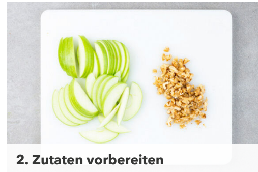
2. Zutaten vorbereiten

Das Fleisch in dem Paniermehl-Mix wenden und auf etwas Küchenkrepp beiseitelegen.