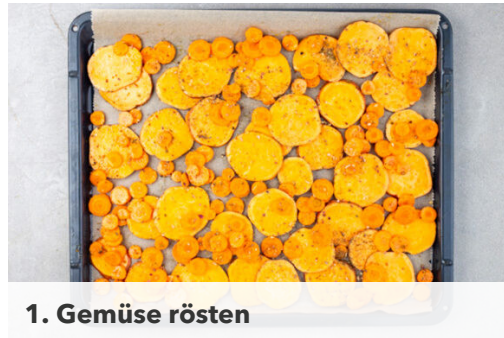
1. Gemüse rösten

Energie 989kcal, Fett 58.8g, Kohlenhydrate 70.2g, Eiweiß 42.0g