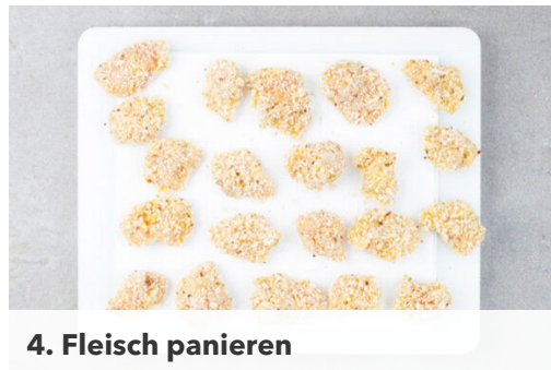
4. Fleisch panieren

Den Backofen auf 230°C (210°C Umluft) vorheizen. Die Süßkartoffeln samt Schale in dünne Scheiben schneiden. Die Karotte ggf. schälen und ebenfalls in dünne Scheiben schneiden. Das Gemüse auf einem mit Backpapier ausgelegten Backblech verteilen, mit 1TL Gewürzmischung , 1EL Olivenöl und 2 Prisen Salz vermengen und in 15-18Min. im Ofen goldbraun rösten.