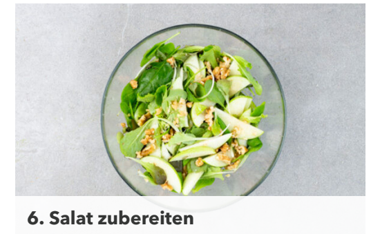
6. Salat zubereiten

Das Panko-Paniermehl in einem tiefen Teller mit 1EL Mehl und der restlichen Gewürzmischung vermengen. 1 Ei in einer Schüssel verquirlen. Das Fleisch trocken tupfen, in mundgerechte, nicht zu kleine Stücke schneiden und durch das verquirlte Ei ziehen.