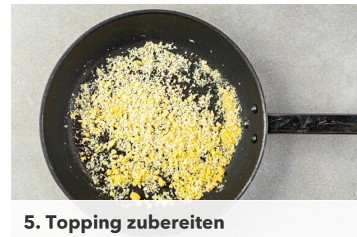
5. Topping zubereiten

Die Pasta in das kochende Wasser geben und in 8-10Min. bissfest kochen. In ein Sieb abgießen und abtropfen lassen.