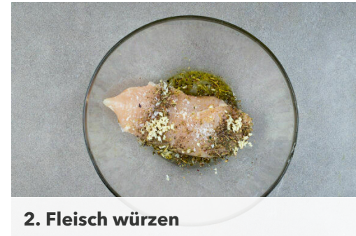
2. Fleisch würzen

Ggf. den Grill vorheizen. Die Zitronenschale abreiben, dann die Zitrone halbieren und auspressen. Den Knoblauch schälen und fein würfeln.