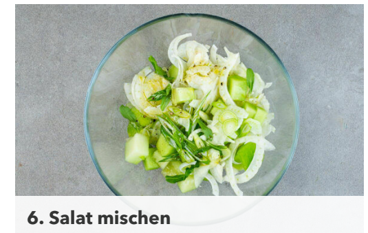
6. Salat mischen

Die Lauchzwiebeln in feine Ringe schneiden, dabei den weißen und den grünen Teil voneinander trennen. Die Estragonblätter abzupfen. Den Käse in dünne Scheiben schneiden oder hobeln.