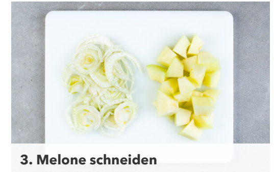
3. Melone schneiden

Das Fleisch trocken tupfen, mit 3EL Olivenöl, 2EL Zitronensaft , der ½ der Gewürzmischung , dem Knoblauch und je 1 Prise Salz und Pfeffer vermengen und ziehen lassen.