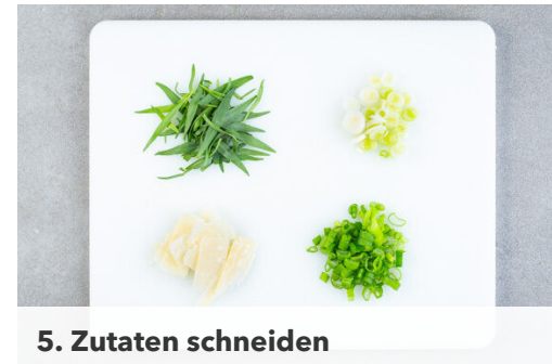
5. Zutaten schneiden

Das Fleisch in einer Grillpfanne oder auf dem Grill bei starker Hitze auf jeder Seite 4-5Min. braten, bis es goldbraun und gar ist.