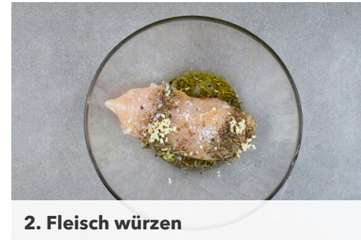
2. Fleisch würzen

Ggf. den Grill vorheizen. Die Zitronenschale abreiben, dann die Zitrone halbieren und auspressen. Den Knoblauch schälen und fein würfeln.