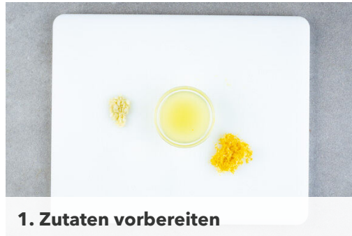
1. Zutaten vorbereiten

Energie 724kcal, Fett 43.1g, Kohlenhydrate 30.7g, Eiweiß 55.5g