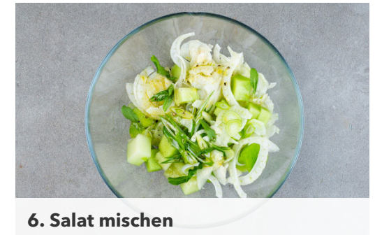
6. Salat mischen

Die Lauchzwiebel in feine Ringe schneiden, dabei den weißen und den grünen Teil voneinander trennen. Die Estragonblätter abzupfen. Den Käse in dünne Scheiben schneiden oder hobeln.