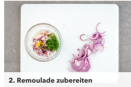
2. Remoulade zubereiten

Den Bacon in einer großen Pfanne ohne Zugabe von Fett bei mittlerer bis starker Hitze ca. 1Min. auf jeder Seite knusprig braten, dann auf etwas Küchenkrepp beiseitestellen und die Pfanne aufbewahren. Die Burgerbrötchen aufschneiden und mit der Schnittfläche nach oben auf den Pommes oder einem Backrost für die letzten ca. 3Min. der Backzeit aufbacken.