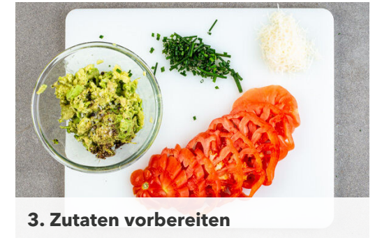
3. Zutaten vorbereiten

Die Rindfleischpattys in derselben Pfanne mit 1EL Olivenöl bei mittlerer bis starker Hitze auf jeder Seite 3-4Min. gar braten, dabei die Zwiebelstreifen mit 1 kräftigen Prise Salz um die Pattys verteilen und mitbraten. 1EL Olivenöl, 1EL Balsamicoessig, ½TL Honig und je 1 Prise Salz und Pfeffer zu einem Dressing verrühren.