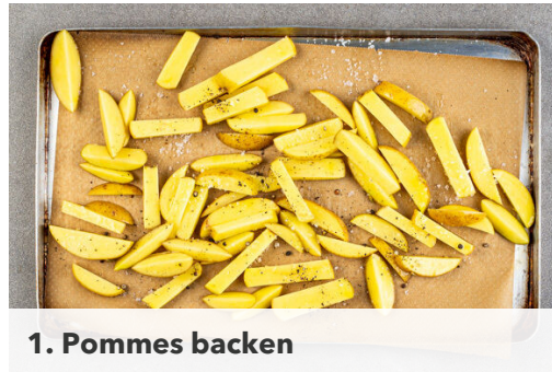
1. Pommes backen

Energie 1382kcal, Fett 97.2g, Kohlenhydrate 86.7g, Eiweiß 45.6g