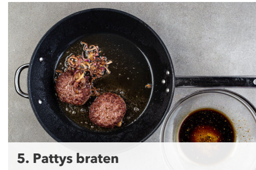
5. Pattys braten

Den Dill samt Stängeln fein schneiden. Die Zwiebel schälen, halbieren und eine Hälfte in dünne Streifen schneiden, die andere Hälfte fein würfeln. Die Zwiebelwürfel mit dem Dill , 4EL Mayonnaise, 1TL Senf, ½TL hellem Essig und je 1 Prise Salz und Pfeffer verrühren. Die Remoulade bis zum Servieren im Kühlschrank kalt stellen.