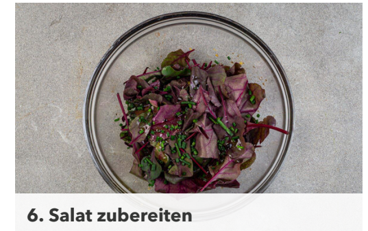
6. Salat zubereiten

Die Tomate in dünne Scheiben schneiden. Die Avocado halbieren und den Kern entfernen. Das Fruchtfleisch mit einem Löffel aus der Schale lösen, mit einer Gabel grob zerdrücken und mit je 1 Prise Salz und Pfeffer würzen. Den Schnittlauch in feine Röllchen schneiden und den Käse fein reiben.