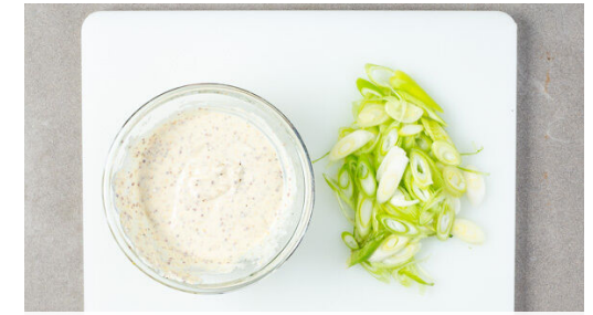
3. Dressing anrühren

Die Würste in derselben Pfanne mit 1EL Olivenöl auf jeder Seite 4-6Min. goldbraun anbraten.