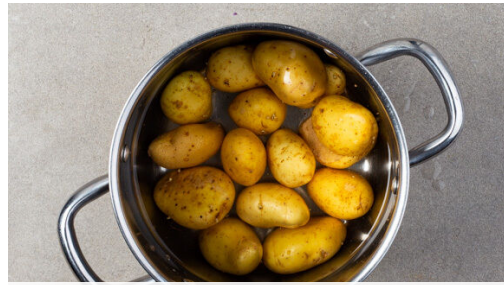
1. Kartoffeln kochen

Energie 1016kcal, Fett 55.7g, Kohlenhydrate 52.3g, Eiweiß 42.3g