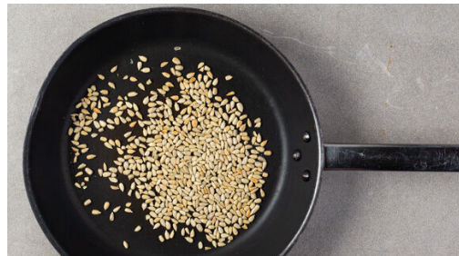
4. Sonnenblumenkerne rösten

In zwei mittelgroßen Töpfen mit Deckeln ausreichend gesalzenes Wasser für die Kartoffeln bzw. den Brokkoli zum Kochen bringen. Die Kartoffeln samt Schale in einem der Töpfe 15-20Min. kochen, bis sie gar sind. In ein Sieb abgießen und mit kaltem Wasser abspülen.