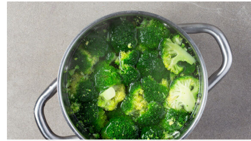
2. Brokkoli kochen

Die Sonnenblumenkerne in einer kleinen Pfanne ohne Zugabe von Fett bei mittlerer bis starker Hitze 3-5Min. anrösten, bis sie leicht gebräunt sind. Aus der Pfanne nehmen und auf einem Teller beiseitestellen.