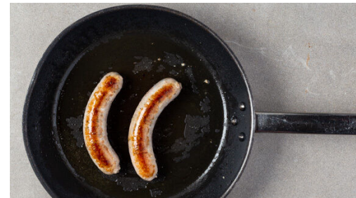
5. Würste braten

Den Brokkoli in mundgerechte Röschen zerteilen und in dem zweiten Topf in 2-3Min. bissfest kochen. Ebenfalls abgießen und kalt abschrecken.