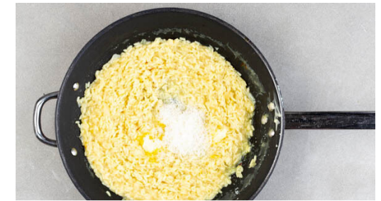
6. Risotto verfeinern

Den Reis hinzufügen und 1-2Min. leicht anrösten, dann nach und nach mit der Safranbrühe ablöschen und stetig rühren, damit der Reis nicht ansetzt. Diesen Vorgang 18-20Min. lang wiederholen, bis die Brühe aufgebraucht und der Reis bissfest ist. Evtl. etwas mehr Wasser zugeben.