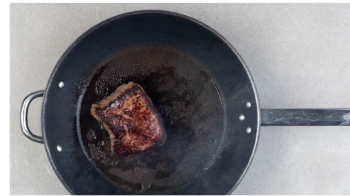
5. Fleisch braten

Die Zwiebeln schälen, halbieren und fein würfeln. Den Knoblauch schälen und in feine Scheibchen schneiden. Die Zwiebeln und den Knoblauch in einer großen Pfanne mit 2EL Butter bei mittlerer Hitze in 2-3Min. glasig anschwitzen.