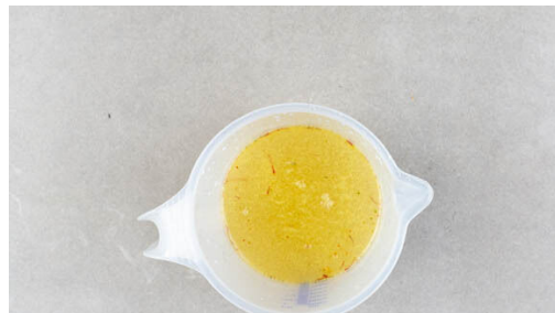
1. Safranbrühe zubereiten

Energie 879kcal, Fett 38.0g, Kohlenhydrate 89.5g, Eiweiß 41.9g