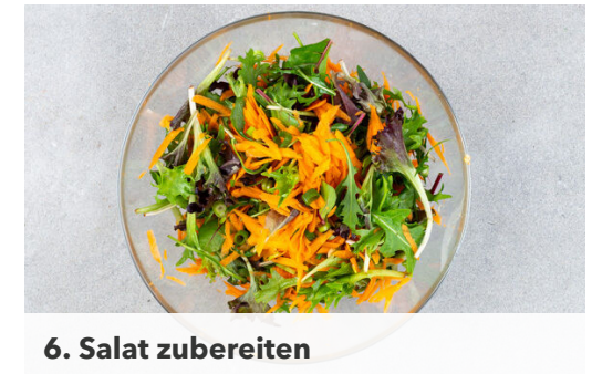
6. Salat zubereiten

2EL Olivenöl mit 1EL Essig, 2TL Senf sowie 2EL Wasser zu einem Dressing verrühren und mit Salz und Pfeffer abschmecken.