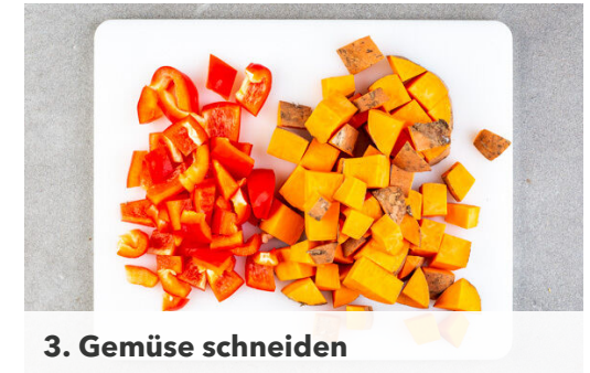
3. Gemüse schneiden

Die Kürbiskerne fein hacken, auf einem Teller verteilen und die Hähnchenschenkel von beiden Seiten in den Kürbiskernen wenden. Auf zwei mit Backpapier ausgelegte Backbleche geben und ca. 15Min. im unteren Drittel des Ofens backen.