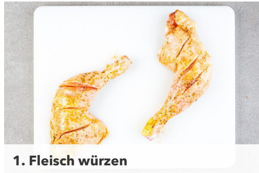
1. Fleisch würzen

Energie 805kcal, Fett 45.7g, Kohlenhydrate 50.2g, Eiweiß 42.9g