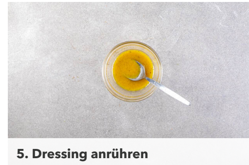
5. Dressing anrühren

Das Gemüse mit der restlichen Gewürzmischung , 1EL Olivenöl sowie je 1 kräftigen Prise Salz und Pfeffer vermengen. Das Gemüse nach 15Min. Garzeit neben den Hähnchenschenkeln verteilen und 15-20Min. mitbacken, bis das Fleisch gar und das Gemüse weich ist. Dabei die vorherige Position der Bleche tauschen.