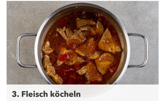
3. Fleisch köcheln

Den Weißkohl in feine Streifen schneiden und ca. 30Sek. mit den Händen weich kneten. Die Lauchzwiebeln in dünne Ringe schneiden und mit dem Weißkohl , 4EL Mayonnaise, 2EL Essig und je 1 kräftigen Prise Salz, Pfeffer und Zucker zu einem Coleslaw vermengen. Die übrigen 1,5 Tomaten in dünne Scheiben schneiden. Die Zwiebel schälen und ebenfalls in dünne Scheiben schneiden.