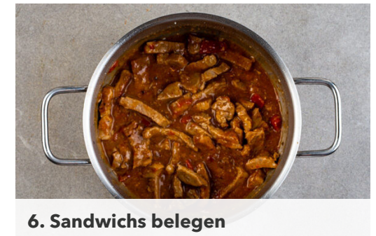
6. Sandwichs belegen

Das Fleisch in einem großen Topf mit 2EL Pflanzenöl bei mittlerer Hitze 2-3Min. goldbraun anbraten, dann die Hitze reduzieren, den Knoblauch hinzufügen und ca. 30Sek. mitbraten. Mit 2EL Mehl bestäuben, dann die Tomatenwürfel , die Chilibrühe , die BBQ-Sauce sowie je 1 kräftige Prise Salz und Pfeffer einrühren und bei mittlerer Hitze 35-45Min. köcheln lassen.