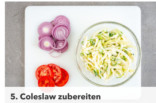
5. Coleslaw zubereiten

Das Fleisch trocken tupfen, jeweils vierteln und ggf. größere Fettstücke entfernen. Beide Seiten mit je 1 Prise Salz und Pfeffer würzen.