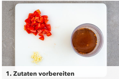
1. Zutaten vorbereiten

Energie 777kcal, Fett 39.4g, Kohlenhydrate 68.8g, Eiweiß 36.8g