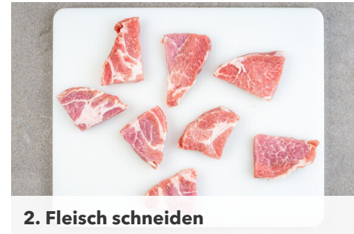
2. Fleisch schneiden

Den Backofen auf 240°C (220°C Umluft) vorheizen. Wenn das Fleisch ca. 15Min. geköchelt hat, die Süßkartoffeln samt Schale in 3-5mm dünne Scheiben schneiden, auf einem mit Backpapier ausgelegten Backblech mit 2EL Pflanzenöl, 1/2TL Salz und 1 kräftigen Prise Pfeffer vermengen und gleichmäßig verteilen. Im Ofen in ca. 20Min. goldbraun backen, dabei einmal wenden.