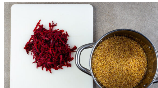
2. Bulgur köcheln

Den Fenchel vom harten Strunk und den Stängeln befreien, evtl. vorhandenes Fenchelgrün für die Garnitur aufbewahren. Den Fenchel längs halbieren und in dünne Streifen schneiden. Die Zitrone halbieren und auspressen.