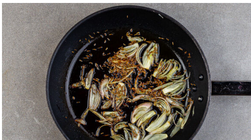
1. Schalotten anschwitzen

Energie 893kcal, Fett 49.2g, Kohlenhydrate 65.3g, Eiweiß 40.4g