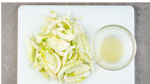
4. Fenchel schneiden

In einem mittelgroßen Topf 600ml leicht gesalzenes Wasser zum Kochen bringen. Die Schalotten schälen und in feine Streifen schneiden. Den Knoblauch schälen und grob würfeln. Die Schalotten in einer großen Pfanne mit 2EL Pflanzenöl bei mittlerer bis starker Hitze ca. 5Min. anschwitzen.