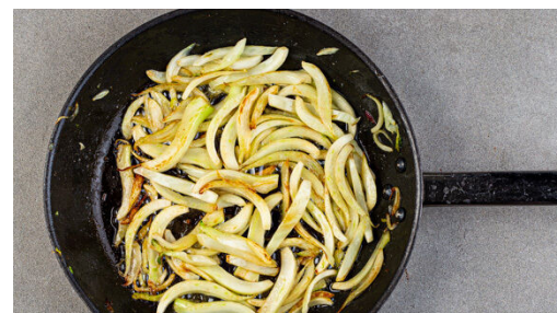
5. Fenchel braten

Den Bulgur in das kochende Wasser rühren und abgedeckt bei niedriger Hitze 5-7Min. sanft köcheln lassen, bis das Wasser aufgesaugt und der Bulgur gar ist. Noch ca. 5Min. ohne Hitzezufuhr ziehen lassen. Inzwischen die Roten Beten schälen und grob raspeln. Tipp: Da Rote Bete stark färbt, beim Verarbeiten am besten Küchenhandschuhe und Schürze tragen.