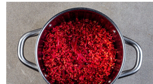
3. Rote Bete garen

Den Fenchel in einer großen Pfanne mit 1EL Butter und je 1 kräftigen Prise Salz und Pfeffer bei mittlerer bis starker Hitze ca. 5Min. braten, bis er leicht gebräunt ist. Bei mittlerer Hitze ca. 2Min. weitergaren. Den Fisch mit kaltem Wasser abspülen, trocken tupfen, evtl. vorhandene Gräten und Schuppen entfernen und mit Salz und Pfeffer würzen.