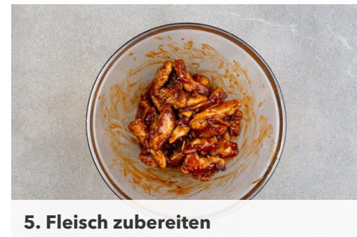
5. Fleisch zubereiten

Nebenher die Tortillas nacheinander in einer zweiten Pfanne bei mittlerer Hitze auf jeder Seite ca. 30Sek. erwärmen. Die fertigen Tortillas auf einem Teller mit einem Geschirrtuch abgedeckt warm halten.