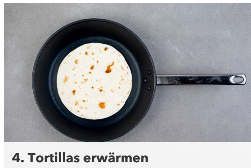
4. Tortillas erwärmen

Das Fleisch in einer großen Pfanne mit 2EL Pflanzenöl bei mittlerer Hitze auf jeder Seite 4-5Min. anbraten, bis das Fleisch goldbraun und durch ist.