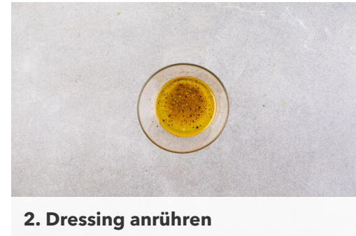
2. Dressing anrühren

Den Salat in dünne Streifen schneiden, dabei den Strunk entfernen. Die Zwiebel schälen, halbieren und in feine Streifen schneiden. Die Tomaten klein würfeln.