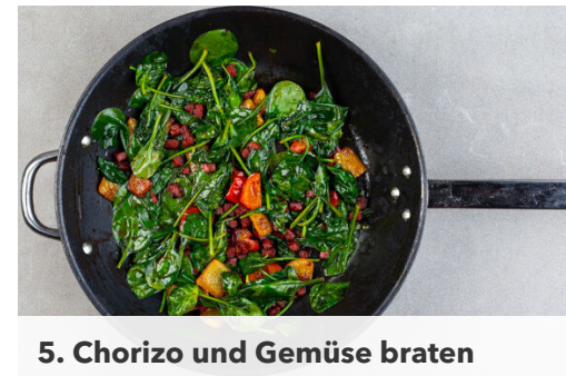
5. Chorizo und Gemüse braten

Den Knoblauch schälen und halbieren. Die getrockneten Tomaten grob würfeln. Die ½ des Basilikums samt Stängeln grob schneiden und mit dem Knoblauch , den Tomaten , der ½ des Käses , den Sonnenblumenkernen , 2EL Olivenöl und je 1 Prise Salz und Pfeffer zur Paprika in das Püriergefäß geben und alles zu einem glatten Pesto mixen.