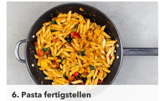
6. Pasta fertigstellen

Die Paprika aus der Pfanne nehmen und auf einem Teller beiseitestellen. In der Pfanne die Chorizo mit 2TL Olivenöl bei starker Hitze 2-3Min. anbraten. Die Hitze etwas reduzieren, die Paprikastücke und den Spinat zugeben und bei mittlerer bis starker Hitze 1-2min. mitbraten, bis der Spinat zusammengefallen ist. Mit Salz und Pfeffer würzen.