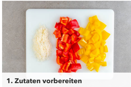
1. Zutaten vorbereiten

Energie 847kcal, Fett 40.2g, Kohlenhydrate 87.5g, Eiweiß 30.7g