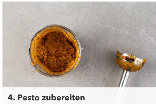
4. Pesto zubereiten

Die Pasta in das kochende Wasser geben und in 8-10Min. bissfest kochen. Mit einer Tasse etwas Kochwasser abschöpfen, dann die Pasta in ein Sieb abgießen und abtropfen lassen.