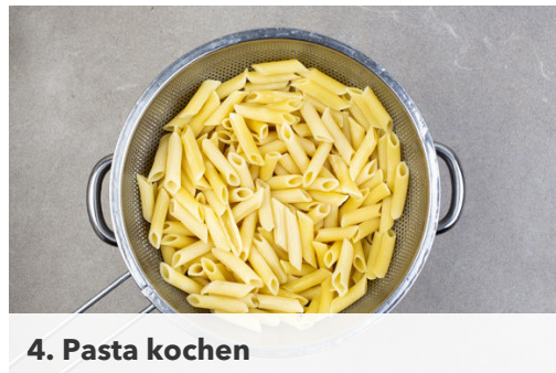
4. Pasta kochen

In einem großen Topf ausreichend gesalzenes Wasser für die Pasta zum Kochen bringen. Die Zwiebel schälen, halbieren und feine Streifen schneiden. Den Knoblauch schälen und in feine Scheibchen schneiden. Den Spinat ggf. verlesen.