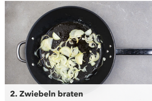
2. Zwiebeln braten

Die Pasta in das kochende Wasser geben und in 8-10Min. bissfest kochen. In ein Sieb abgießen und abtropfen lassen.