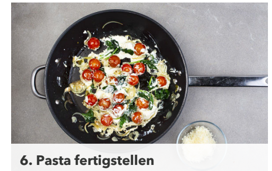
6. Pasta fertigstellen

Wenn leichte Röstspuren am Knoblauch zu sehen sind, ca. ¾ des Spinats nach und nach hinzugeben und schwenken, bis er zusammengefallen ist. Die Kirschtomaten dazugeben und heiß werden lassen. Die Pinienkerne in einer kleinen Pfanne ohne Zugabe von Fett bei mittlerer Hitze 1-2Min. goldbraun anrösten, dann aus der Pfanne nehmen. Vorsicht , sie können schnell zu dunkel werden.