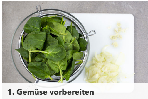
1. Gemüse vorbereiten

Energie 682kcal, Fett 25.0g, Kohlenhydrate 86.6g, Eiweiß 24.3g