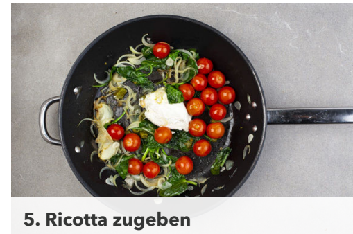
5. Ricotta zugeben

Die Zwiebeln und den Knoblauch in einer großen Pfanne mit 2EL Olivenöl und 1TL Salz bei mittlerer Hitze 1-2Min. anbraten.