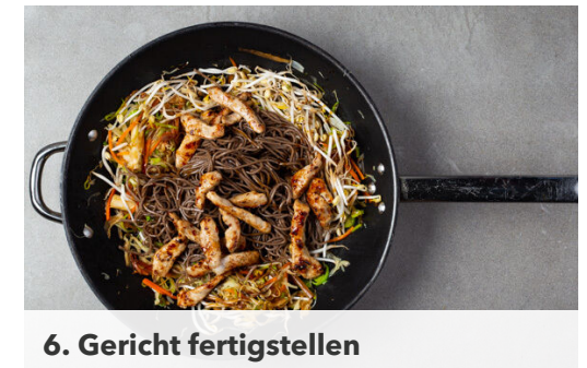
6. Gericht fertigstellen

⅔ der Nudeln in das kochende Wasser geben und in ca. 4Min. bissfest kochen. In ein Sieb abgießen, die Nudeln sehr gründlich mit kaltem Wasser abspülen und abtropfen lassen.