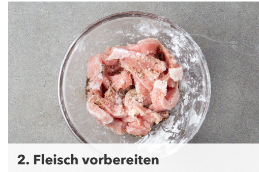
2. Fleisch vorbereiten

Das Fleisch in einer großen Pfanne mit 1EL Pflanzenöl bei starker Hitze 3-4Min. anbraten. Auf einem Teller abgedeckt warm halten.