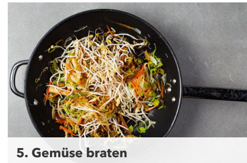
5. Gemüse braten

Das Fleisch trocken tupfen, mit je 1 kräftigen Prise Salz und Pfeffer würzen und mit 1EL Speisestärke vermengen.