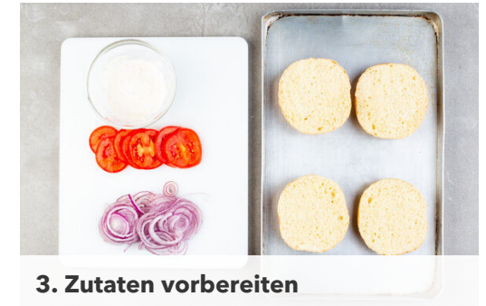
3. Zutaten vorbereiten

Kurz vor Ende der Garzeit den Käse auf den Pattys verteilen, die Pfanne abdecken und den Käse ca. 1Min. schmelzen lassen.