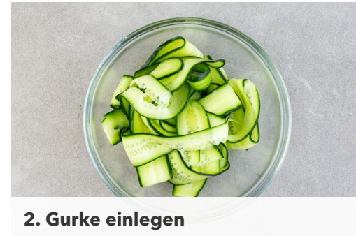
2. Gurke einlegen

In einer großen Pfanne 1EL Pflanzenöl stark erhitzen. Die Kugeln in das heiße Öl geben und sofort mit einem breiten Pfannenwender flach drücken, die entstehenden Pattys sollten max. 1cm dick sein. Die Pattys ohne Wenden 2-3Min. braten, dann die Oberseiten gleichmäßig mit insgesamt 1EL Senf bestreichen. Die Pattys wenden und 2-3Min. weiterbraten, bis das Fleisch durch ist.