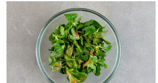
6. Salat zubereiten

Den Brokkoli und die Paprika in einer großen Pfanne mit 1EL Olivenöl bei mittlerer bis starker Hitze ca. 5Min. anbraten, dann die Bohnen mit 2EL Wasser hinzufügen und 3-4Min. mitkochen, bis der Brokkoli gar ist. Das Gemüse mit der Limettenschale , Salz und Pfeffer abschmecken.