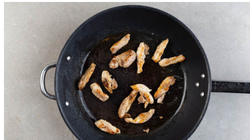
4. Fleisch braten

Die Zwiebel schälen, halbieren und in feine Streifen schneiden. In einem kleinen Topf 2EL Wasser, 2EL Essig, ½TL Zucker und 1 Prise Salz bei starker Hitze ca. 2Min. erwärmen, bis der Zucker sich auflöst. Die Zwiebeln in den Einlegesud geben und beiseitestellen.