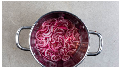
1. Zwiebeln einlegen

Energie 679kcal, Fett 25.6g, Kohlenhydrate 31.5g, Eiweiß 41.1g