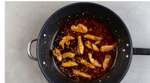
5. Sauce zubereiten

Den Brokkoli in mundgerechte Röschen schneiden. Die Paprika vierteln, entkernen und in dünne Streifen schneiden. Die Bohnen in einem Sieb mit kaltem Wasser abspülen und abtropfen lassen. Die Limettenschale fein abreiben, dann die Limette halbieren und auspressen.