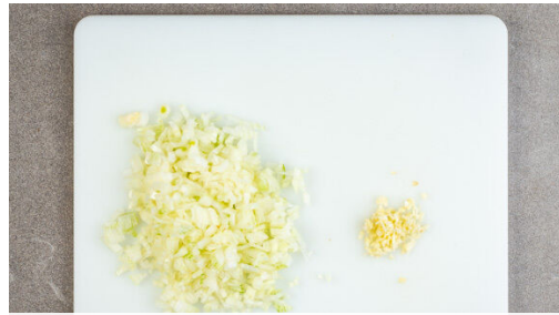
1. Zwiebel schneiden

Energie 1015kcal, Fett 70.3g, Kohlenhydrate 56.5g, Eiweiß 34.4g