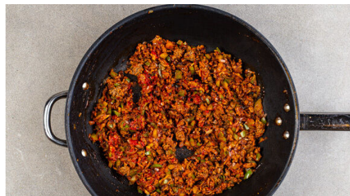
4. Füllung fertigstellen

Das Hackfleisch in einer großen Pfanne mit 2EL Olivenöl bei mittlerer Hitze in 3-4Min. krümelig anbraten.