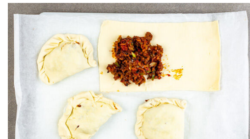
5. Teigtaschen füllen

Die Zwiebeln , den Knoblauch und die Paprika zum Fleisch in die Pfanne geben und 2-3Min. mitbraten. Das Paprikapulver nach Geschmack und das Tomatenmark unterrühren, mit 80ml Wasser ablöschen und alles 2-3Min. sanft einköcheln lassen. Anschließend ca. \frac{1}{3} der Petersilie unterrühren. Mit Salz und Pfeffer abschmecken.