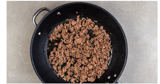
3. Hackfleisch braten

Die Paprika vierteln, entkernen und in ca. 0,5cm kleine Würfel schneiden. Die Petersilie samt Stängeln fein hacken.