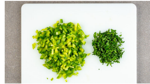
2. Paprika schneiden

Den Backofen auf 220°C (200°C Umluft) vorheizen. Die Teige bis zur Verwendung im Kühlschrank aufbewahren. Die Zwiebeln schälen, halbieren und in möglichst kleine Würfel schneiden. Den Knoblauch schälen und ebenfalls fein würfeln.