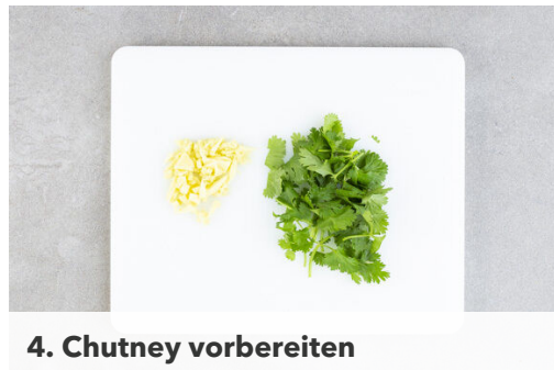
4. Chutney vorbereiten

Die Paprika vierteln, entkernen und in dünne Streifen schneiden. Den Lauch längs halbieren und quer in feine in Streifen schneiden. Den Reis in einem Sieb unter fließendem Wasser abspülen, bis das Wasser klar bleibt.