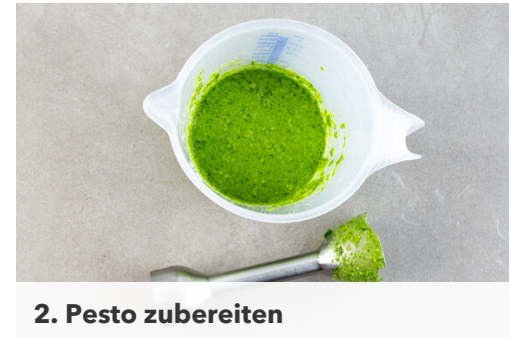
2. Pesto zubereiten

Die Pasta in das kochende Wasser geben und in 7-9Min. bissfest kochen. Mit einem Messbecher ca. 250ml Kochwasser abschöpfen, dann die Pasta in ein Sieb abgießen und abtropfen lassen.