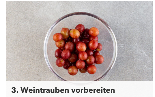
3. Weintrauben vorbereiten

Das Fleisch trocken tupfen, mit 2TL Pesto vermengen und in einer mittelgroßen Pfanne mit 1EL Olivenöl bei starker Hitze ca. 3Min. anbraten. Mit je 1 kräftigen Prise Salz und Pfeffer würzen. Die Trauben , 2EL Wasser und das restliche Pesto dazugeben und weitere 2-3Min. braten, bis das Fleisch gar ist.