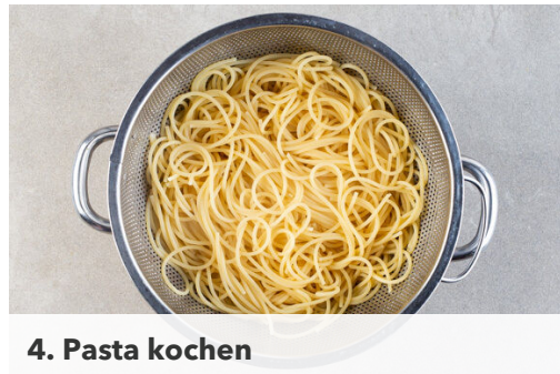
4. Pasta kochen

In einem mittelgroßen Topf ausreichend gesalzenes Wasser für die Pasta zum Kochen bringen. Den Knoblauch schälen und halbieren. Das Basilikum und die Petersilie samt Stängeln grob schneiden. Den Käse fein reiben.