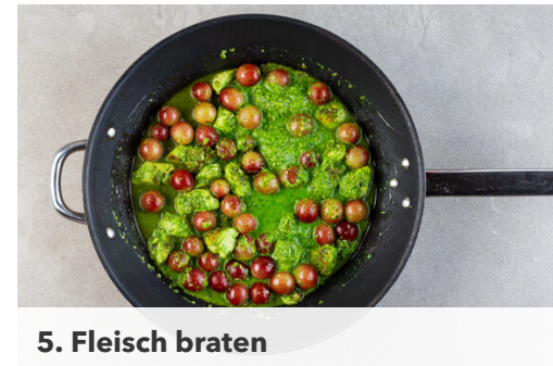
5. Fleisch braten

Das Basilikum , die Petersilie , die Mandeln , die 1/2 des Käses , 1 Handvoll Spinat und den Knoblauch mit 3EL Wasser, 2EL Olivenöl und 1/2TL Salz in einem hohen Gefäß mit einem Stabmixer zu einem Pesto pürieren.