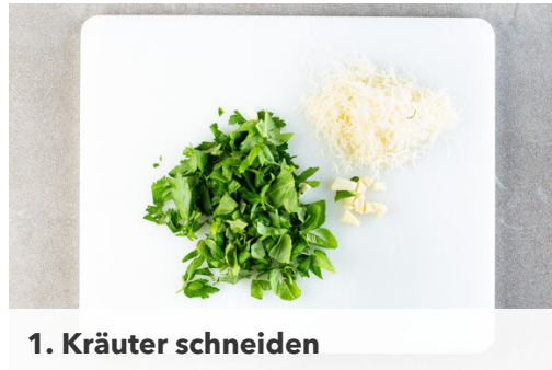
1. Kräuter schneiden

Energie 878kcal, Fett 30.6g, Kohlenhydrate 95.7g, Eiweiß 50.8g