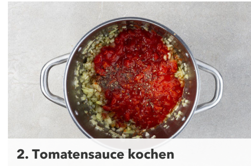
2. Tomatensauce kochen

Die Pasta in das kochende Wasser geben und in 11-13Min. bissfest kochen. In ein Sieb abgießen und abtropfen lassen.