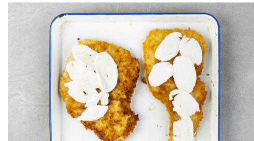
5. Schnitzel überbacken

In einem zweiten mittelgroßen Topf die Zwiebeln mit 1EL Olivenöl bei mittlerer Hitze 1-2Min. farblos anbraten. Den Knoblauch dazugeben und mit den gehackten Tomaten ablöschen. Die Sauce mit je ½TL Salz und Zucker sowie 1 Prise Pfeffer würzen und ca. 5Min. abgedeckt köcheln lassen, dann noch ca. 5Min. ohne Deckel einköcheln.