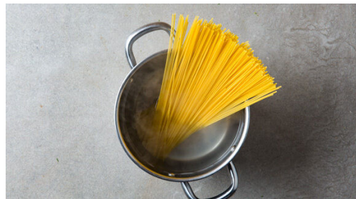
4. Pasta kochen

Den Backofen mit Grillfunktion oder Ober-/Unterhitze auf 220°C vorheizen. In einem mittelgroßen Topf ausreichend gesalzenes Wasser für die Pasta zum Kochen bringen. Die Tomaten in kleine Würfel schneiden. Die Zwiebel und den Knoblauch schälen und fein würfeln.