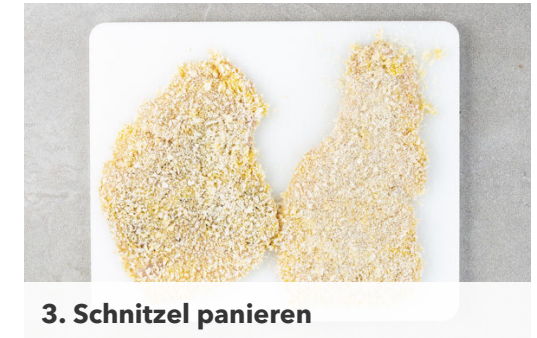
3. Schnitzel panieren

Die Schnitzel in einer großen Pfanne mit 3EL Olivenöl bei mittlerer Hitze auf jeder Seite 1-2Min. anbraten. Die Schnitzel auf etwas Küchenkrepp abtropfen lassen und anschließend in eine mittelgroße Auflaufform geben. Den Mozzarella in dünne Scheiben schneiden, auf den Schnitzeln verteilen und 3-5Min. im Ofen gratinieren, bis der Käse schmilzt.