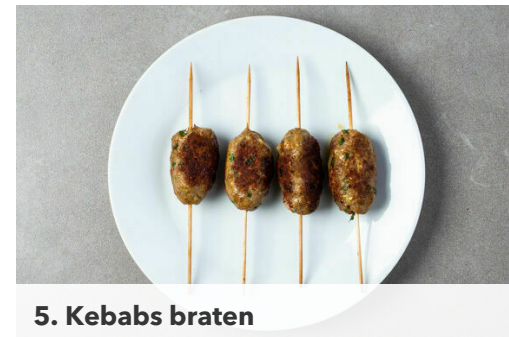
5. Kebabs braten

Die Tomaten vierteln und in einem hohen Gefäß mit 1EL Olivenöl fein pürieren.