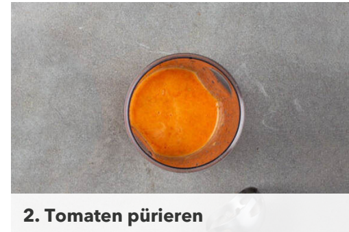
2. Tomaten pürieren

Die Paprika und die Zwiebeln in einer großen Pfanne mit 2EL Olivenöl bei starker Hitze 2-3Min. scharf anbraten. Den restlichen Knoblauch , die pürierten Tomaten und die Zwiebelmarmelade unterrühren und ca. 1Min. mitkochen. Die Pfanne vom Herd nehmen und das Gemüse mit Salz, Pfeffer und Zucker abschmecken. Den Dill unterheben.