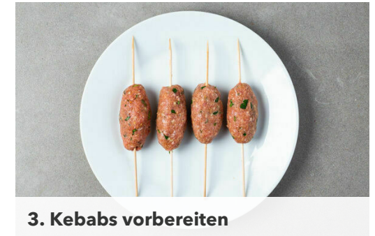
3. Kebabs vorbereiten

Die Kebabs in einer zweiten Pfanne mit 2EL Olivenöl bei mittlerer Hitze 4-5Min. rundum braten, bis das Fleisch durch ist. Die Kebabs auf einem Teller beiseitestellen, die Pfanne auswaschen.