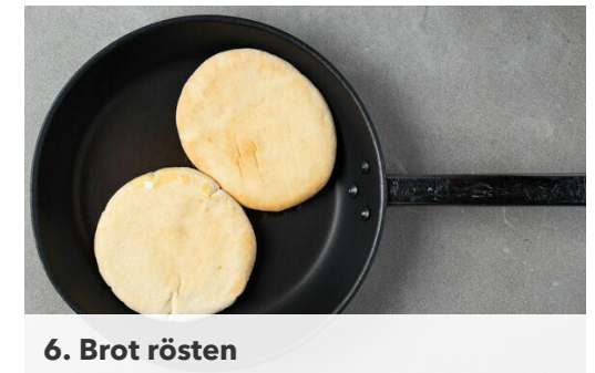
6. Brot rösten

Das Hackfleisch mit der \frac{1}{2} des Knoblauchs , der Petersilie , dem nordafrikanischen Gewürzmischung und je 1 kräftigen Prise Salz und Pfeffer gut verkneten, dann zu 8 länglichen Würsten formen und auf 8 Schaschlikspieße ziehen.