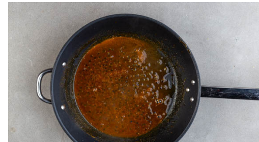
5. Glasur vorbereiten

3EL Mayonnaise mit 1TL Senf, 1TL Essig sowie je 1 Prise Salz und Zucker zu einem Dressing verrühren. In einem kleinen Topf 400ml leicht gesalzenes Wasser für den Reis zum Kochen bringen.