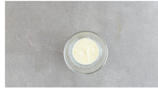
2. Dressing anrühren

Den Reis in einem Sieb kalt abspülen, bis das Wasser klar bleibt. Sobald das Wasser kocht, den Reis hineingeben und abgedeckt bei niedrigster Hitze 10-12Min. kochen, bis das Wasser aufgesogen und der Reis gar ist. Noch ca. 5Min. ohne Hitzezufuhr ziehen lassen.