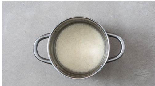
4. Reis kochen

Den Backofen auf 240°C (220°C Umluft) vorheizen. Das Fleisch trocken tupfen, auf einem mit Backpapier ausgelegten Backblech mit 2EL Pflanzenöl und ½TL Salz vermengen und gleichmäßig verteilen. Das Fleisch im vorgeheizten Ofen 30-35Min. backen, bis es gar und goldbraun ist.