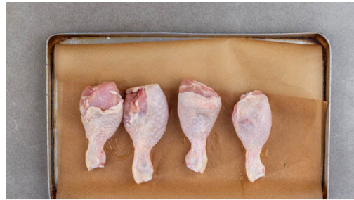
1. Fleisch backen

Energie 1106kcal, Fett 49.0g, Kohlenhydrate 119.6g, Eiweiß 42.6g