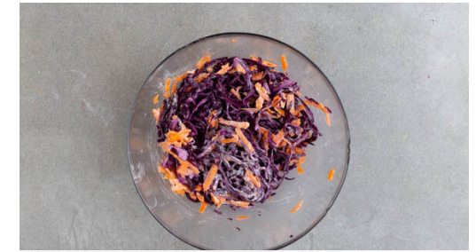
3. Krautsalat vorbereiten

Inzwischen die Passionsfrüchte halbieren und die Kerne samt Saft mit einem Löffel in eine mittelgroße Pfanne kratzen. Die Orange halbieren und auspressen. Den Orangensaft , die Sriracha-Sauce , die Sojasauce , 2EL Ketchup, 1EL Honig, 1-2EL Wasser und 1TL Essig zugeben und die Glasur bei mittlerer Hitze 2-3Min. einköcheln lassen, bis sie eine klebrige Konsistenz hat.