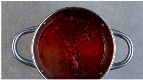
1. Sud aufkochen

Energie 709kcal, Fett 23.6g, Kohlenhydrate 88.7g, Eiweiß 36.7g