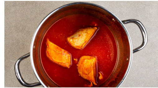
2. Fleisch garen

Die Tomaten in kleine Würfel schneiden. Den Koriander samt Stängeln fein schneiden. Die Zwiebel schälen, halbieren und fein würfeln. Die Tomaten , die Zwiebeln und 3/4 des Korianders mit den Orangenwürfeln samt Saft und der 1/2 des Limettensafts vermengen. Die Salsa mit Salz und Pfeffer abschmecken.