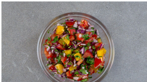
4. Salsa zubereiten

Den Backofen auf 200°C (180°C Umluft) vorheizen. Den Knoblauch fein reiben oder sehr fein würfeln und mit dem Tomatenmark in einem großen Topf mit 1EL Pflanzenöl bei mittlerer Hitze ca. 1Min. unter Rühren anbraten. Je nach gewünschtem Schärfegrad 3/4 der Chiliflocken oder weniger einrühren, dann 3TL Honig und 1TL Salz zugeben und mit 800ml Wasser zum Kochen bringen.