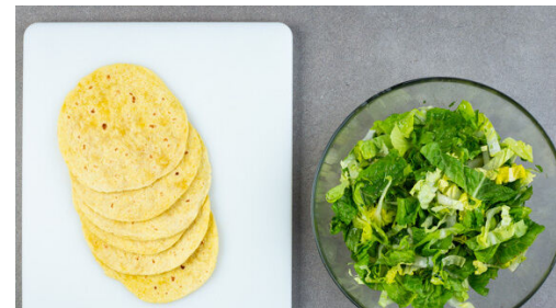
5. Salat vermengen

Das Fleisch trocken tupfen, in jeweils 2-3 gleich große Stücke schneiden und in dem Sud bei starker Hitze in 13-15Min. gar kochen. Tipp: Das Fleisch muss nicht vollständig mit dem Sud bedeckt sein, es sollte aber regelmäßig gewendet werden.