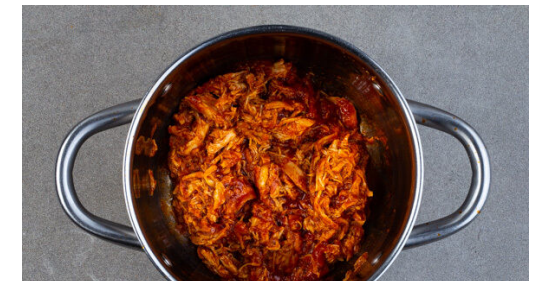
6. Sud einköcheln

Die Orangen schälen, dann ca. 1/4 der Schale in dünne Streifen schneiden und in den Sud geben. Das Fruchtfleisch in ca. 1cm große Würfel schneiden, dabei so viel Orangensaft wie möglich auffangen. Die Limetten halbieren und auspressen.